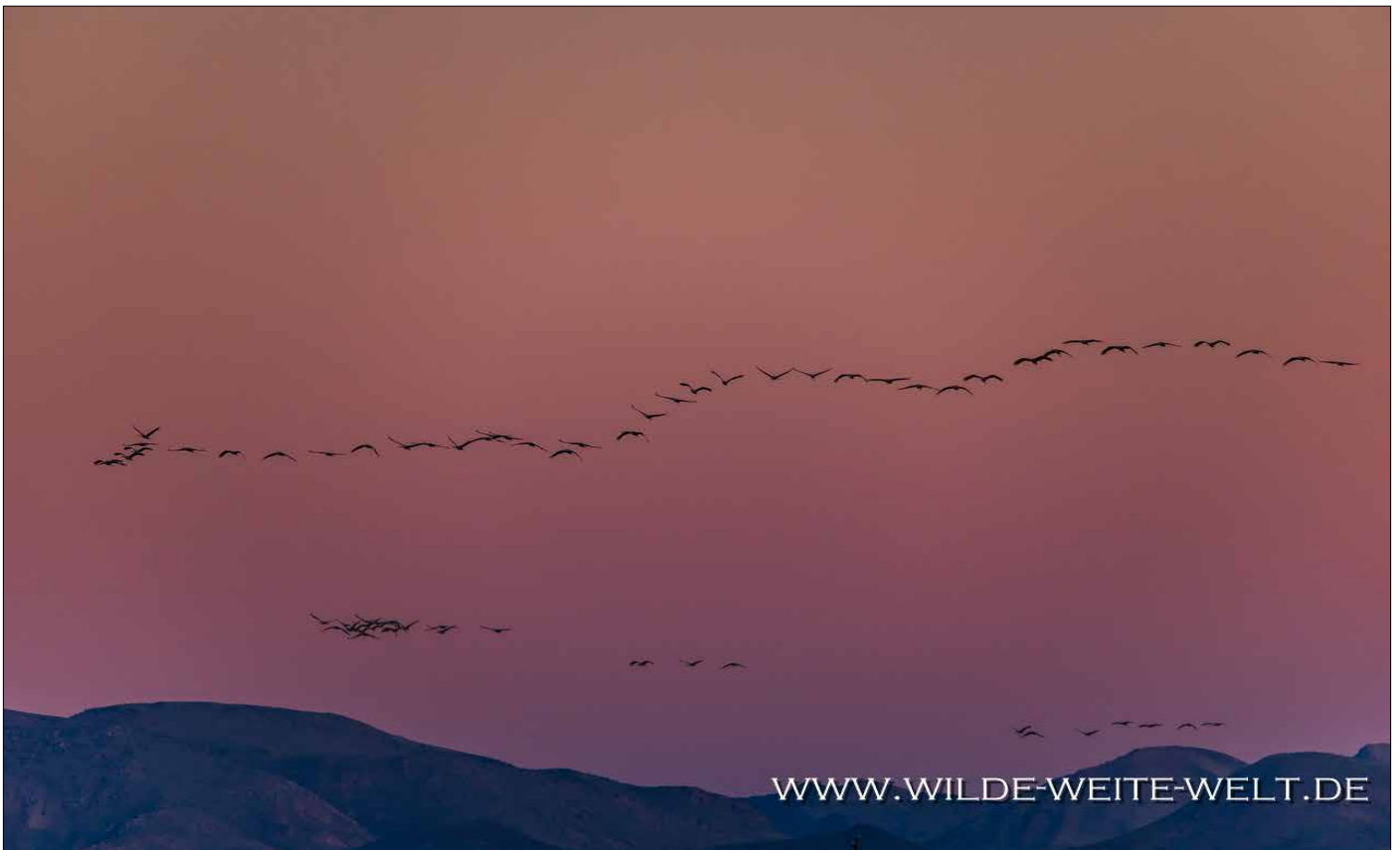
SUNSET VOR DEN SANTA RITA MOUNTAINS