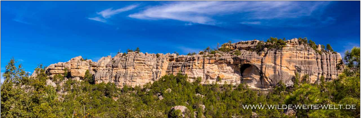
MAGUARICHI ARCH II