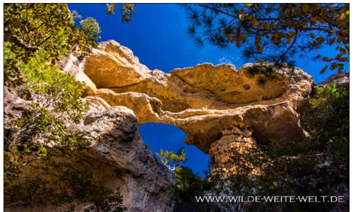
MAGUARICHI TRIPLE ARCH