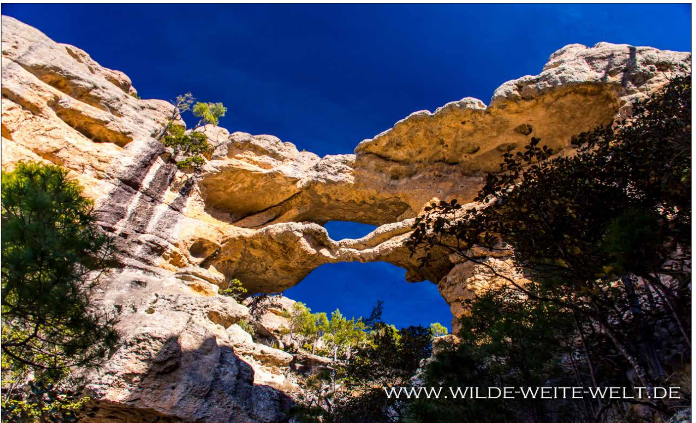
MAGUARICHI TRIPLE ARCH