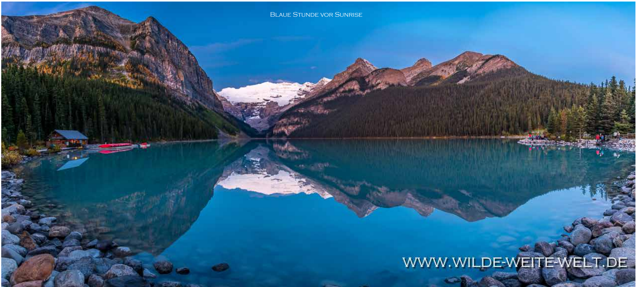
BLAUE STUNDE VOR SUNRISE