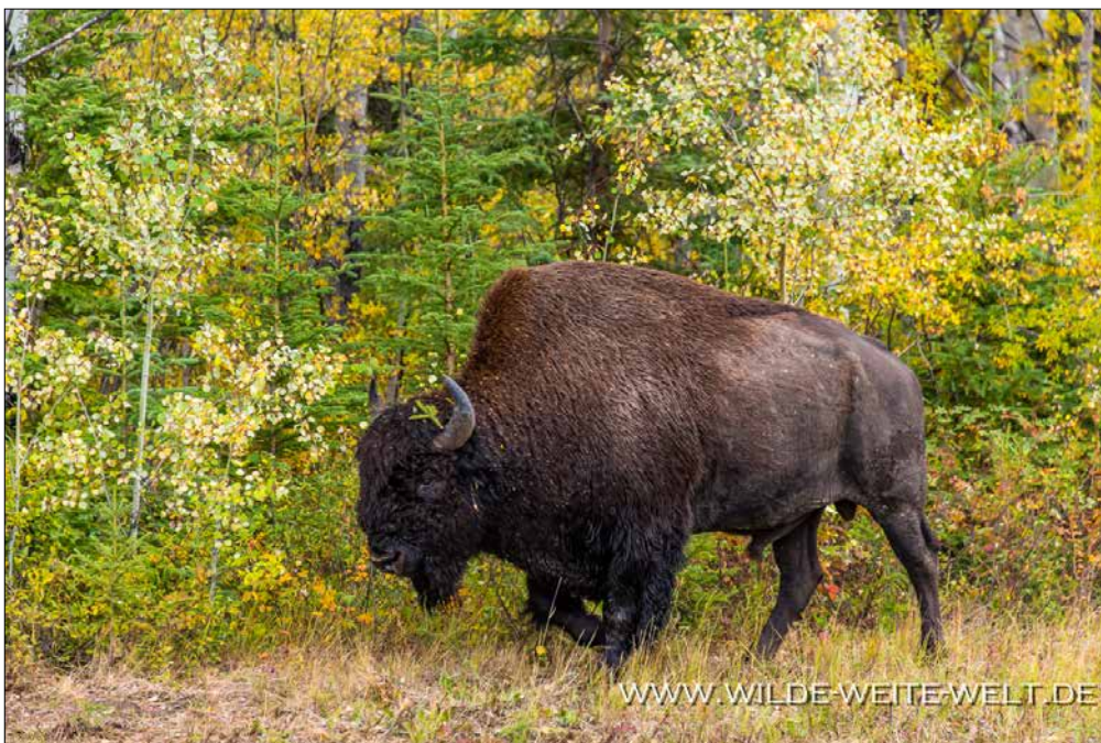
WOOD BUFFALO # 119