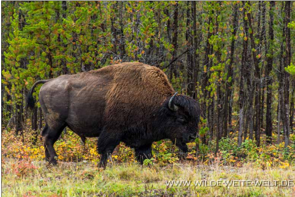
Wood Buffalo # 120