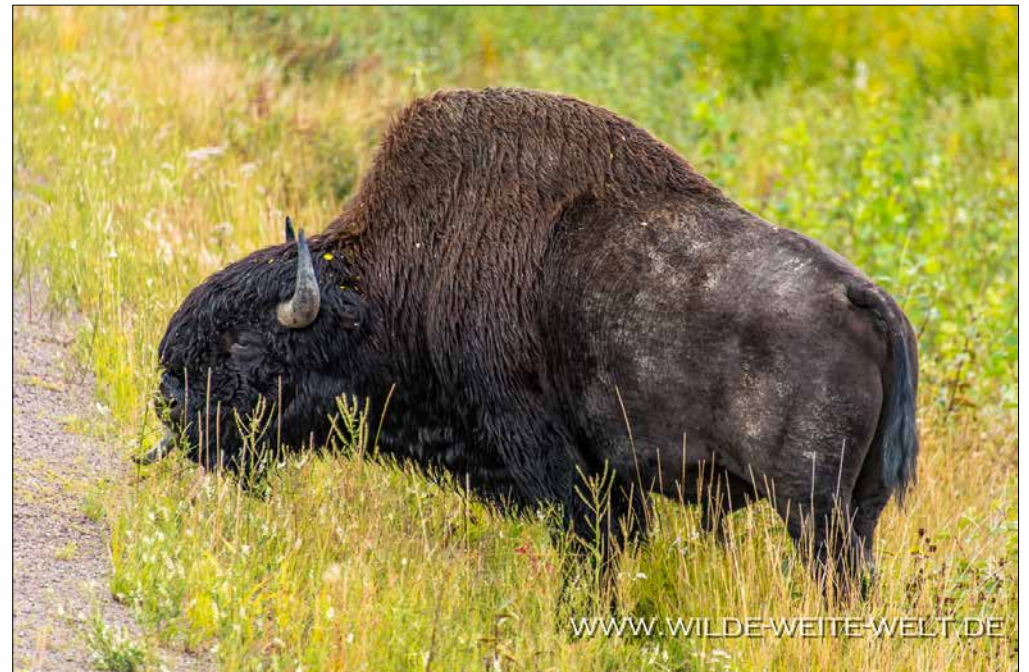
WOOD BUFFALO # 121