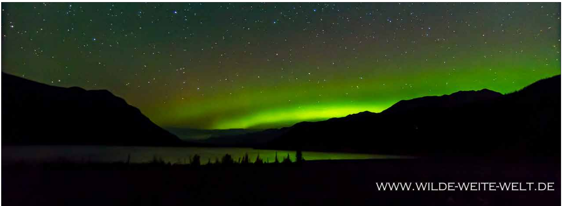
DAS GRÜN DER AURORA BOREALIS SPIEGELT SICH SOGAR EIN WENIG AUF DER WASSEROBERFLÄCHE DES MUNCHO LAKE