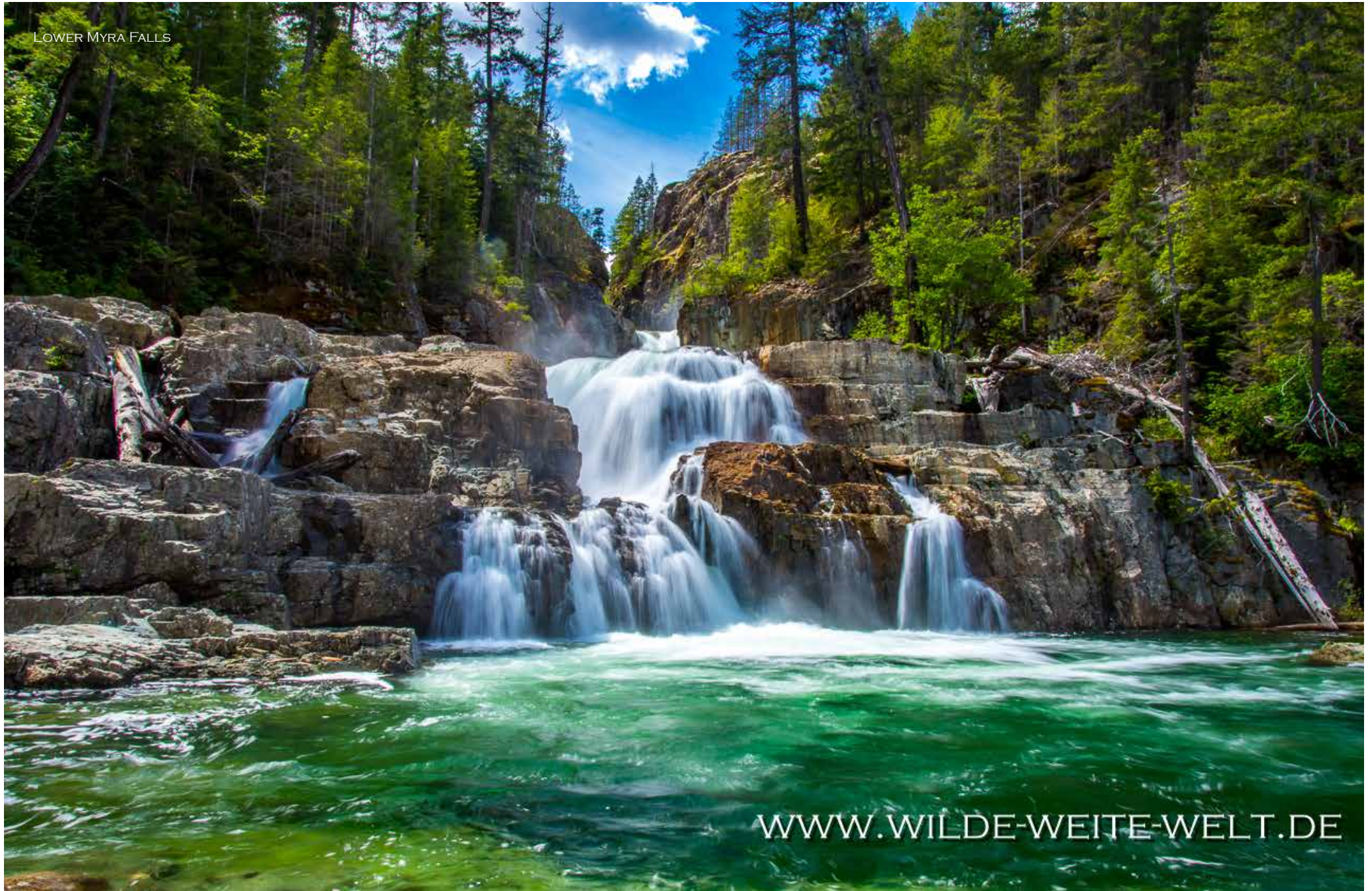
LOWER MYRA FALLS