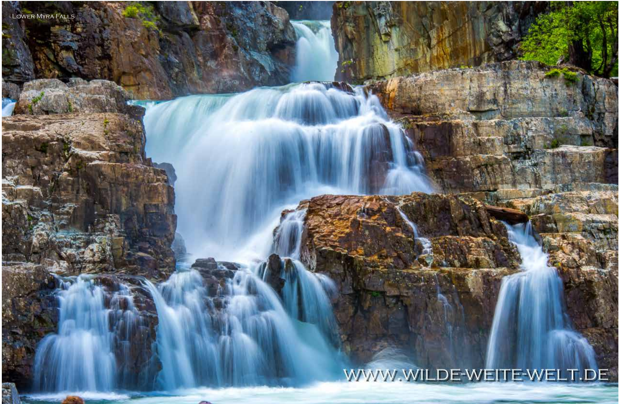
LOWER MYRA FALLS