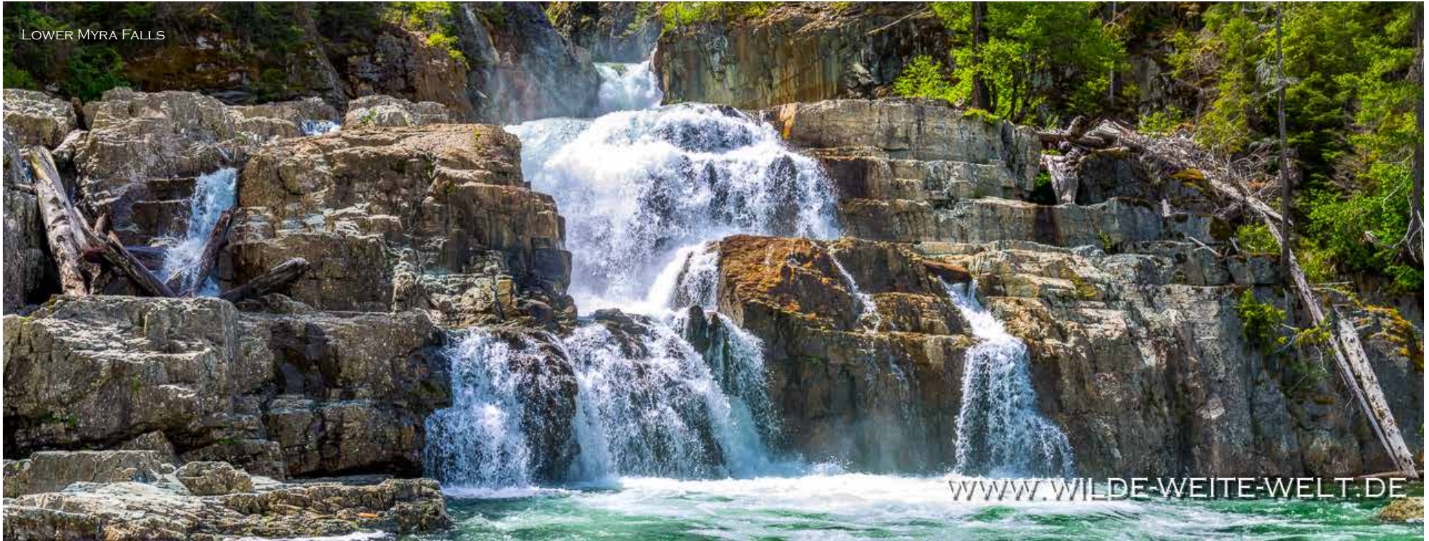
LOWER MYRA FALLS