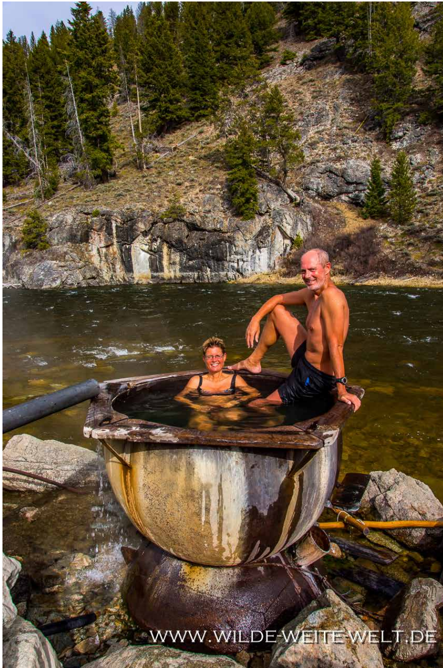
ELKHORN A.K.A. BOAT BOX HOT SPRING