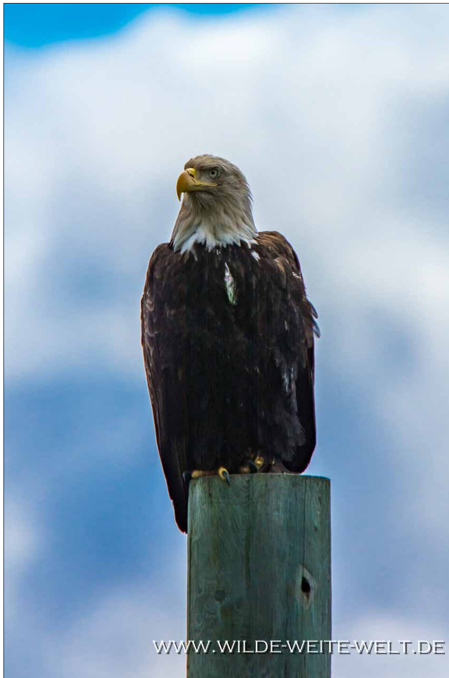
BALD EAGLES IM HAFEN VON GINGOLZ