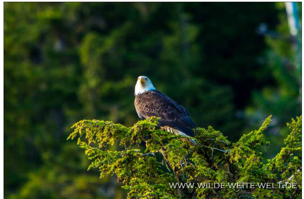
AM NASS RIVER SITZEN BALD EAGLE WOHNIN MAN SCHAUT