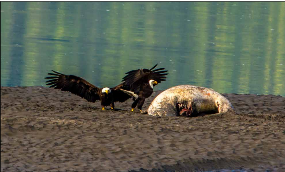
ADLER SIND AUCH NUR GEIER