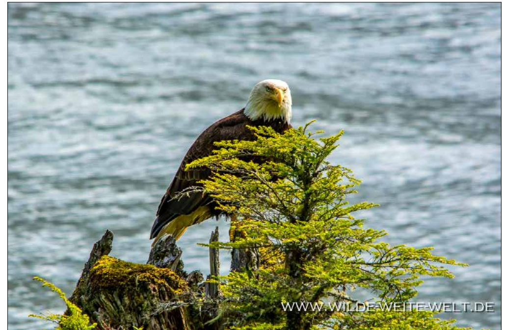
SCHÖNER ANSITZ FÜR EINEN BALD EAGLE