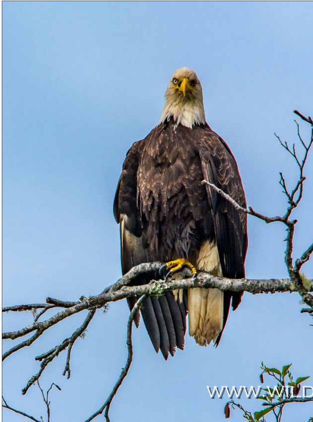
DER EINÄUGIGE PIRAT