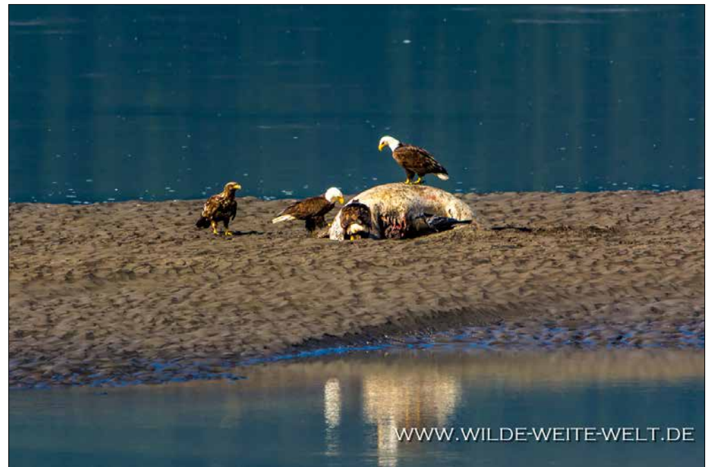
WEISSKOPF-SEEADLER BEIM FESTMAHL