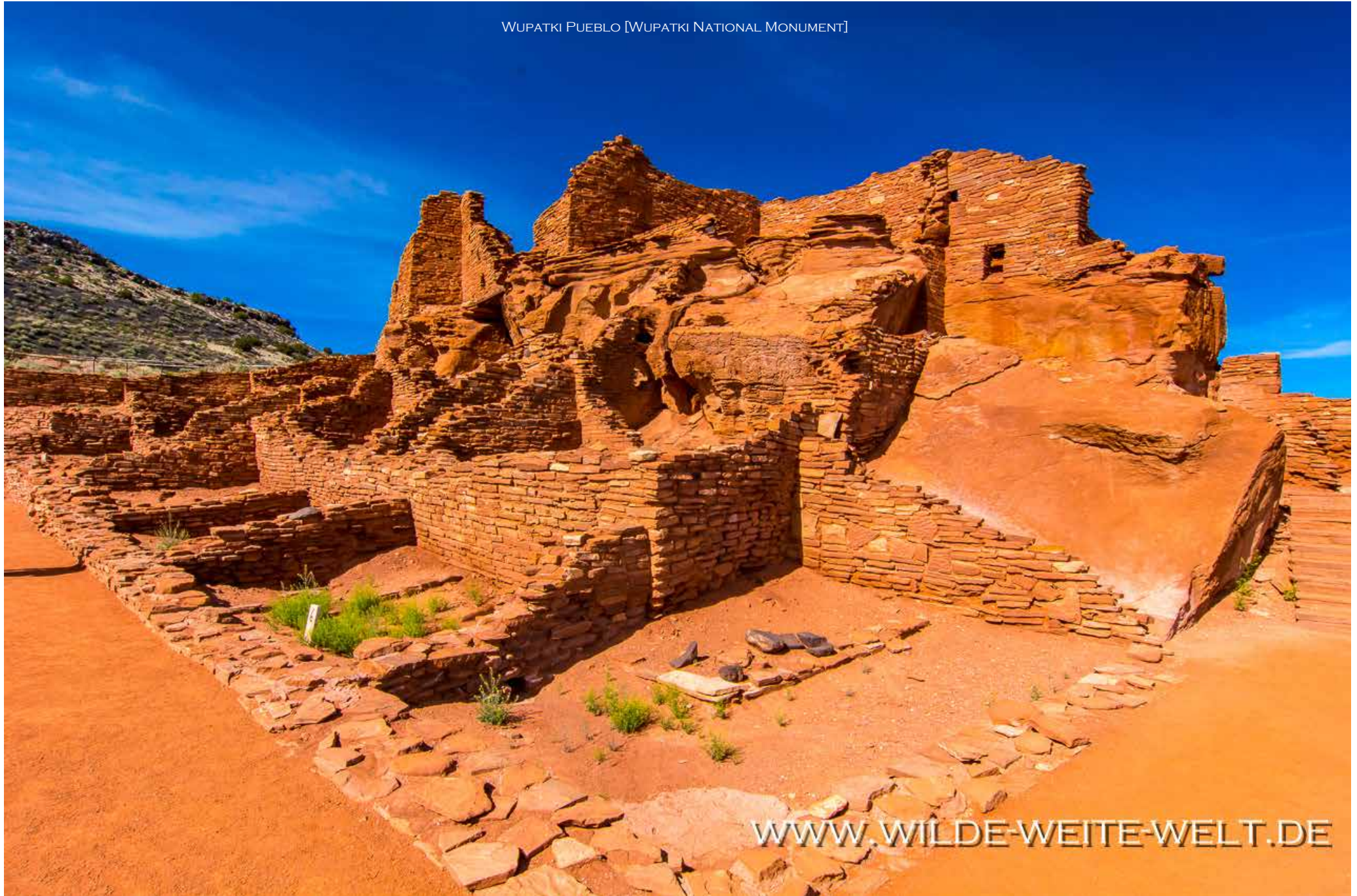
WUPATKI PUEBLO [WUPATKI NATIONAL MONUMENT]