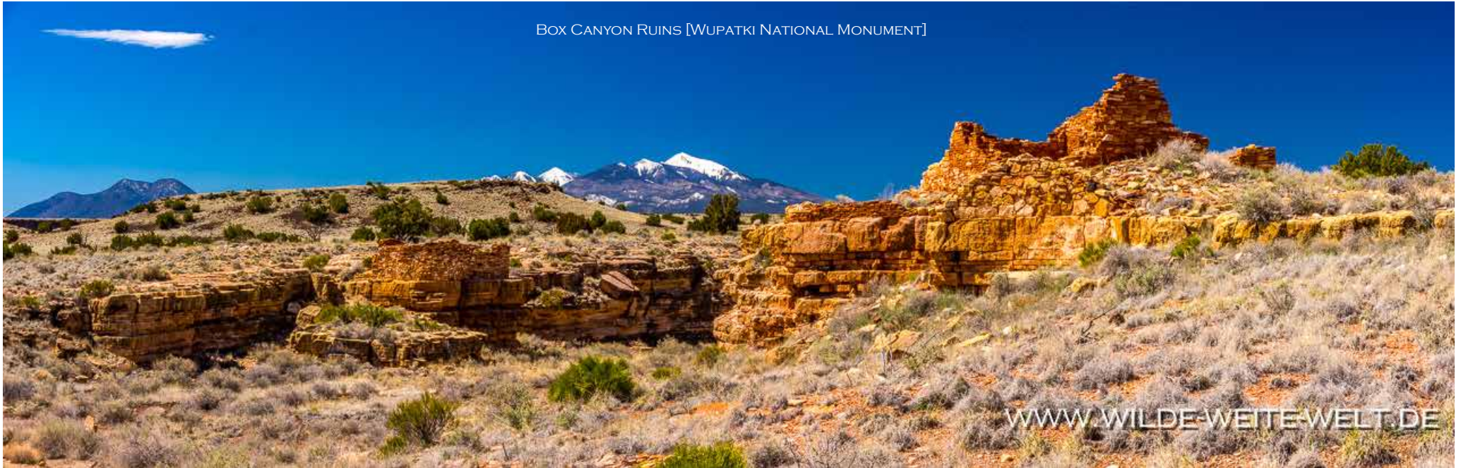
BOX CANYON RUINS [WUPATKI NATIONAL MONUMENT]