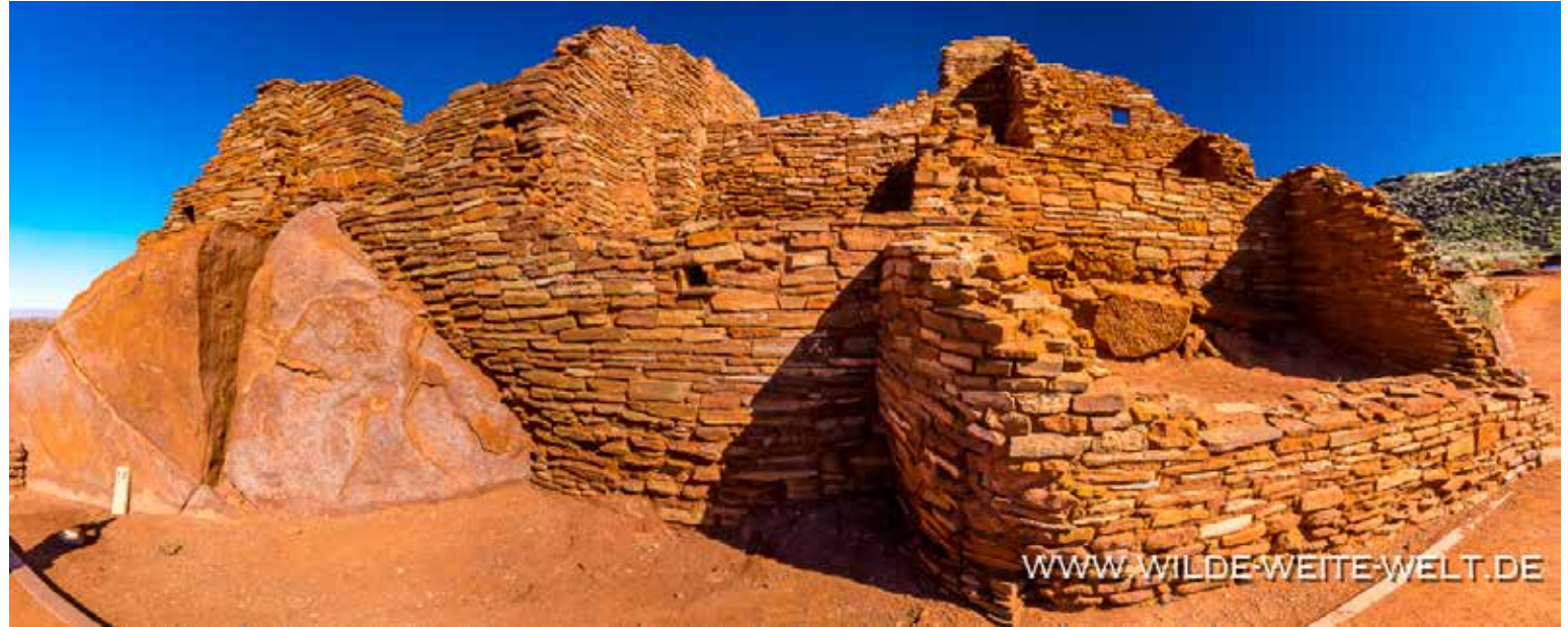
WUPATKI PUEBLO [WUPATKI NATIONAL MONUMENT]

Es sei vorweggenommen: Das Wukoki Pueblo wird in unserem persönlichen Voting heute zur attraktivsten Ruin der USA gekürt, die wir bisher besuchen durften. Die hohen Mauern, die in drei Räumen wie ein Turm auf einem frei stehenden Felsen über der offenen Landschaft thronen, sind ungewöhnlich, markant und fotogen zugleich. Während andere Ruins eher Rudis Resterampe gleichen, kann man sich auch beim großen Nachbarn, dem Wupatki Pueblo richtig vorstellen, wie die Räume dreistöckig eine kleine (nach heutigen Maßstäben, 1100 n.Chr: riesige), städtebauliche Siedlung mit Marktplatz ergeben haben. Auch hier besteht das Einmalige darin, dass die Erbauer große Felsbrocken in ihre Bebauung einbezogen haben und die Mauern auf und zwischen den Felsen errichtet haben. Mehr Einheit aus Natur und Gebautem geht fast nicht, zumal die Steine selbstredend aus dem gleichen, rostroten Material bestehen.