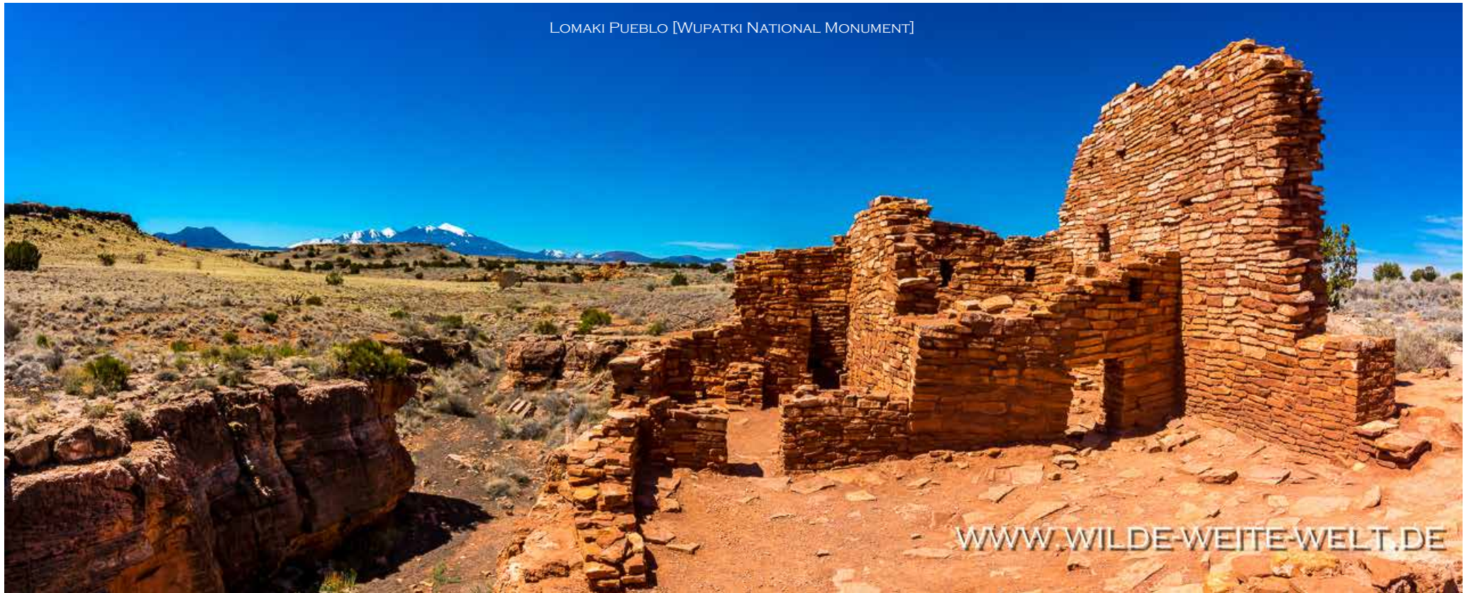
LOMAKI PUEBLO [WUPATKI NATIONAL MONUMENT]