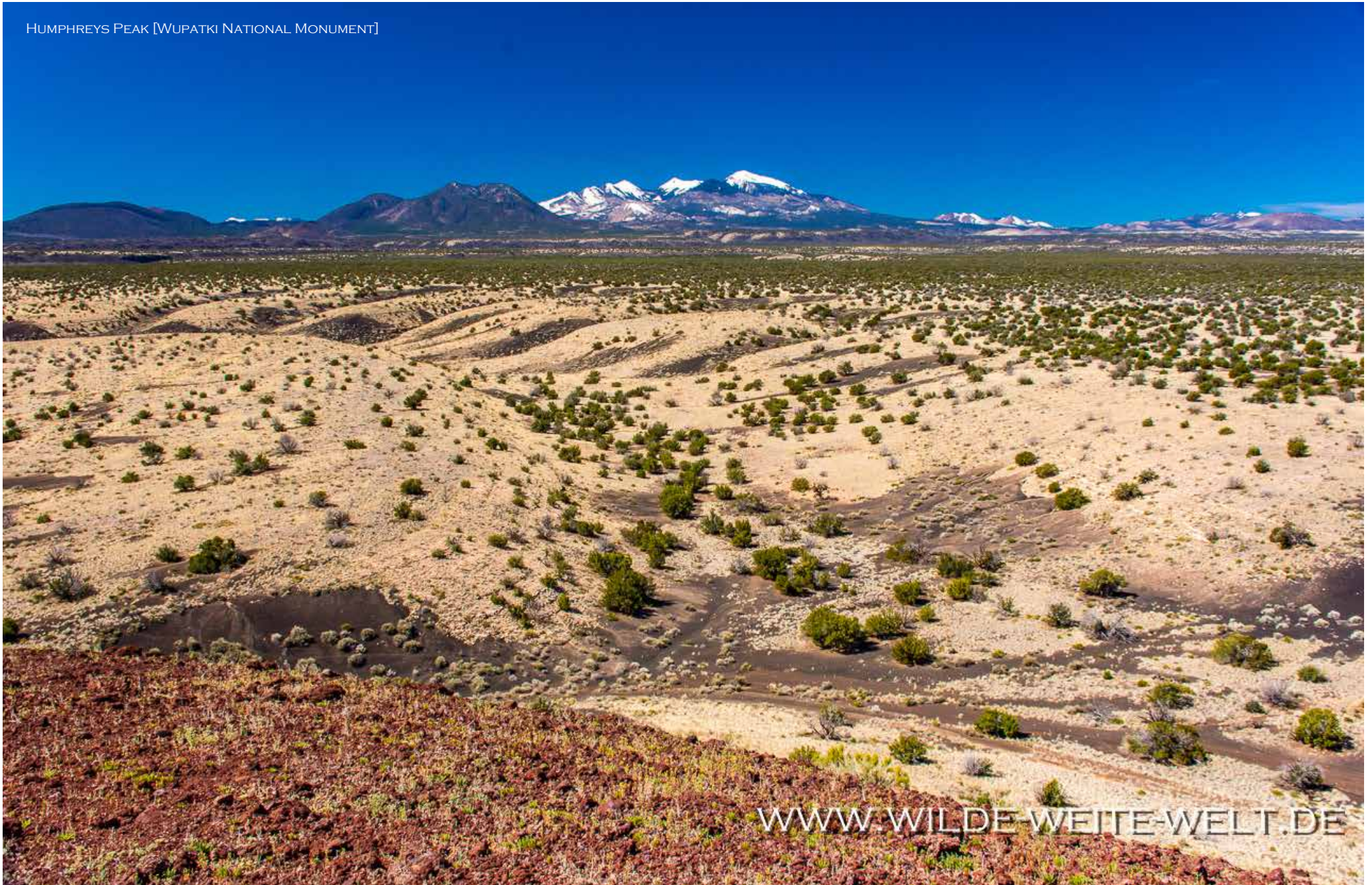
HUMPHREYS PEAK [WUPATKI NATIONAL MONUMENT]