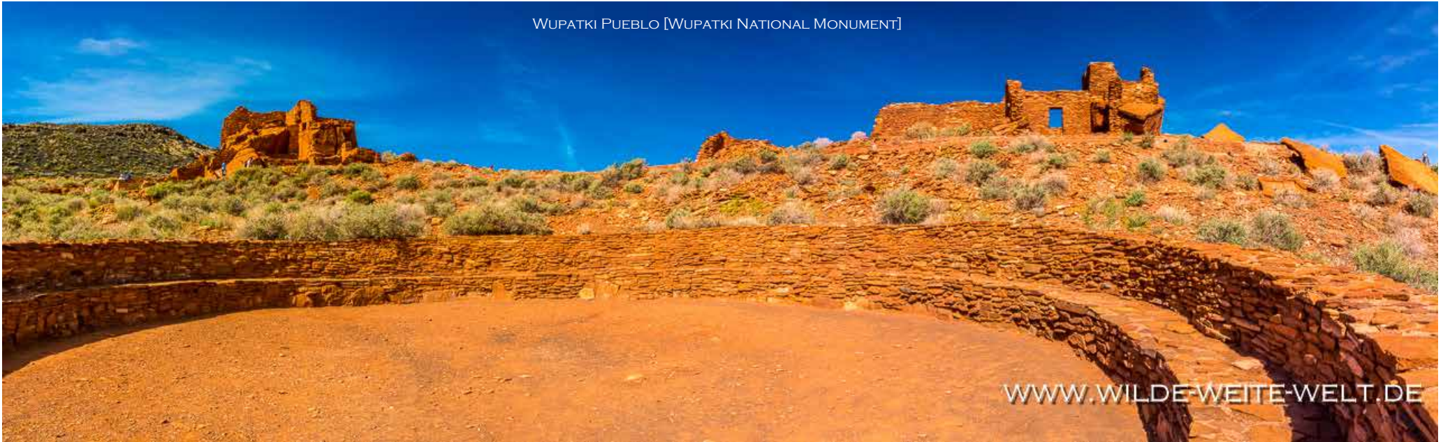
WUPATKI PUEBLO [WUPATKI NATIONAL MONUMENT]