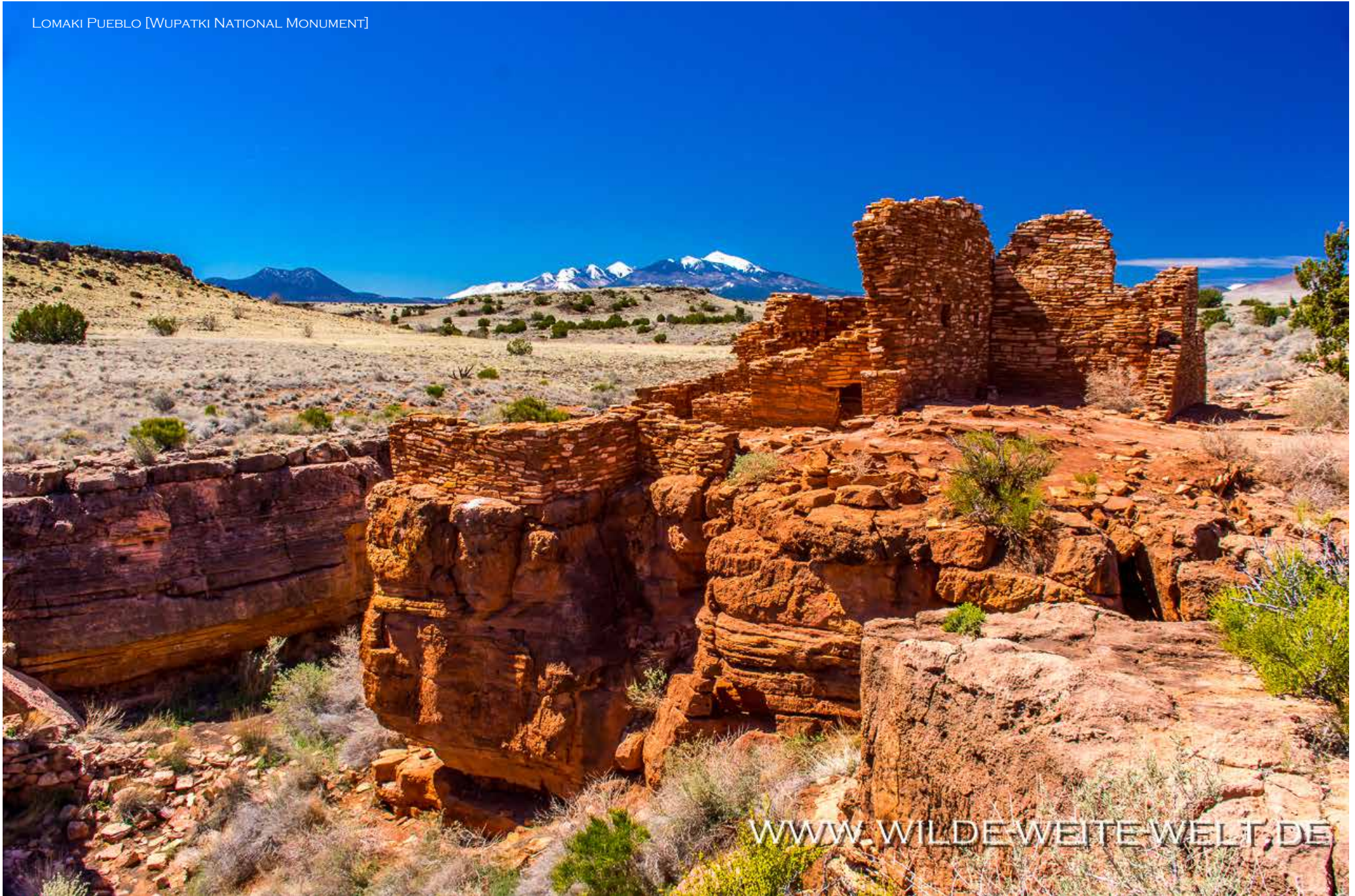
LOMAKI PUEBLO [WUPATKI NATIONAL MONUMENT]