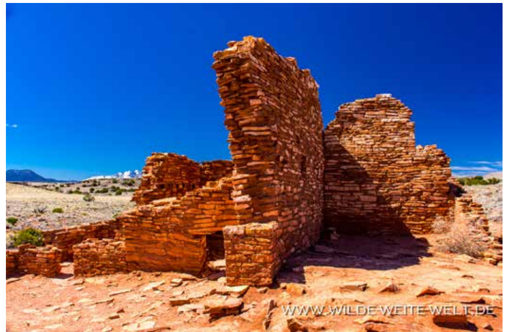
BOX CANYON RUINS [WUPATKI NATIONAL MONUMENT]