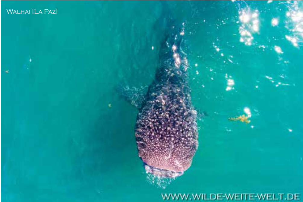
WALHAI [LA PAZ]