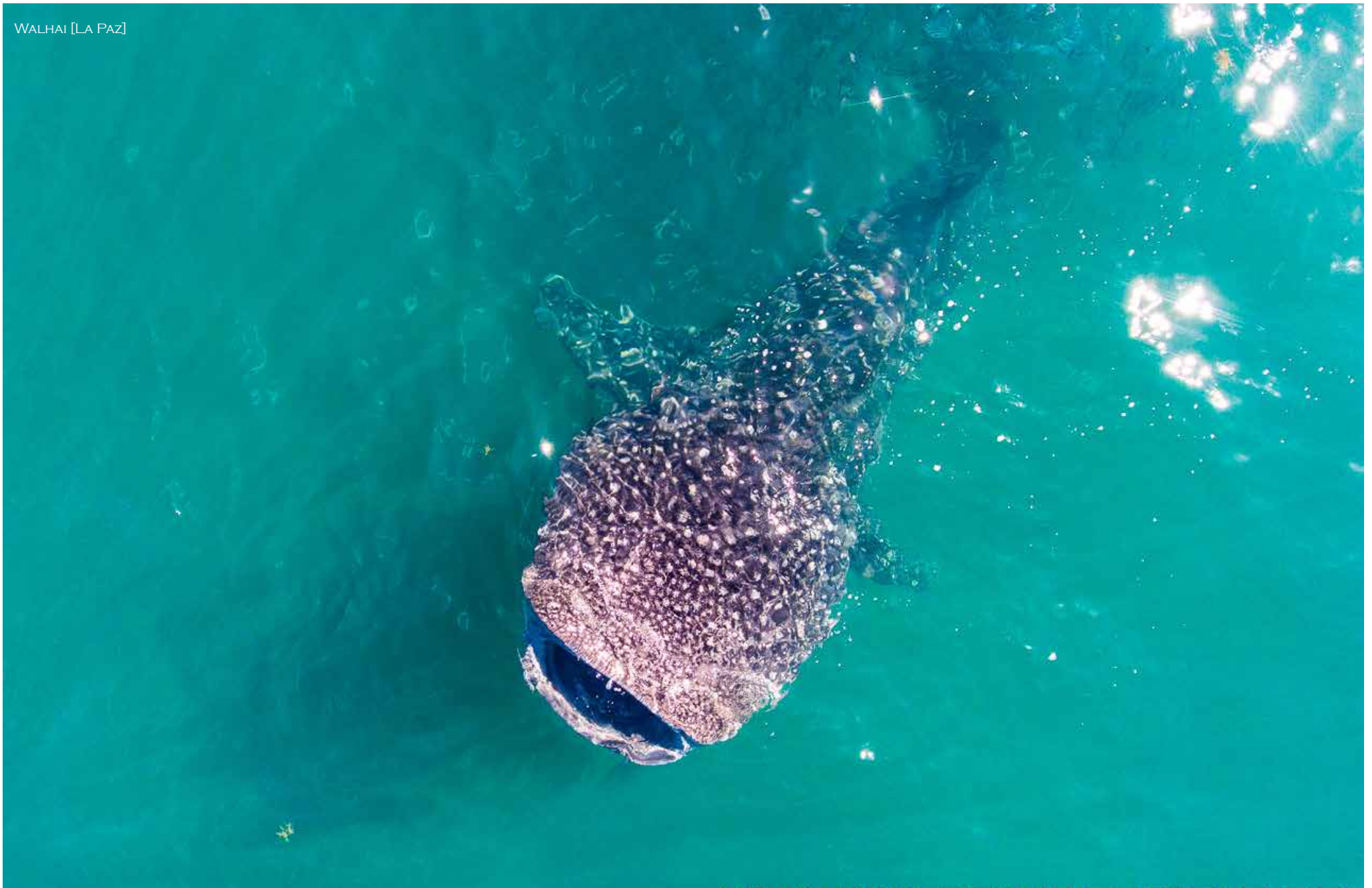
WALHAI [LA PAZ]