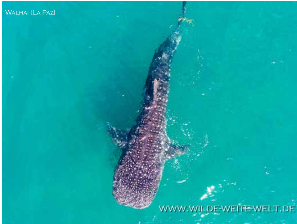
WALHAI [LA PAZ]