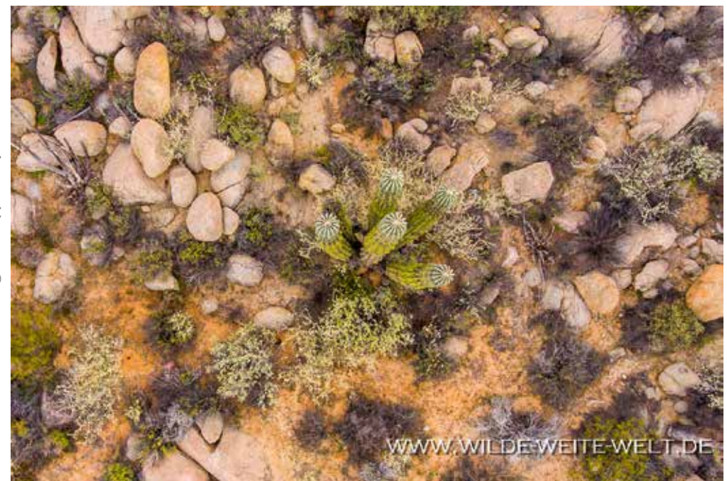
AERIAL VIEW OF CARDON