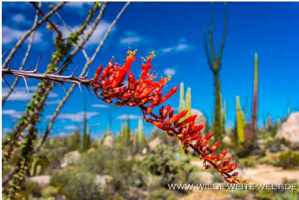
OCOTILLO-BLÜTE, WILDLUMEN & CARCON MIT BARREL CACTUS [CATAVINIA]