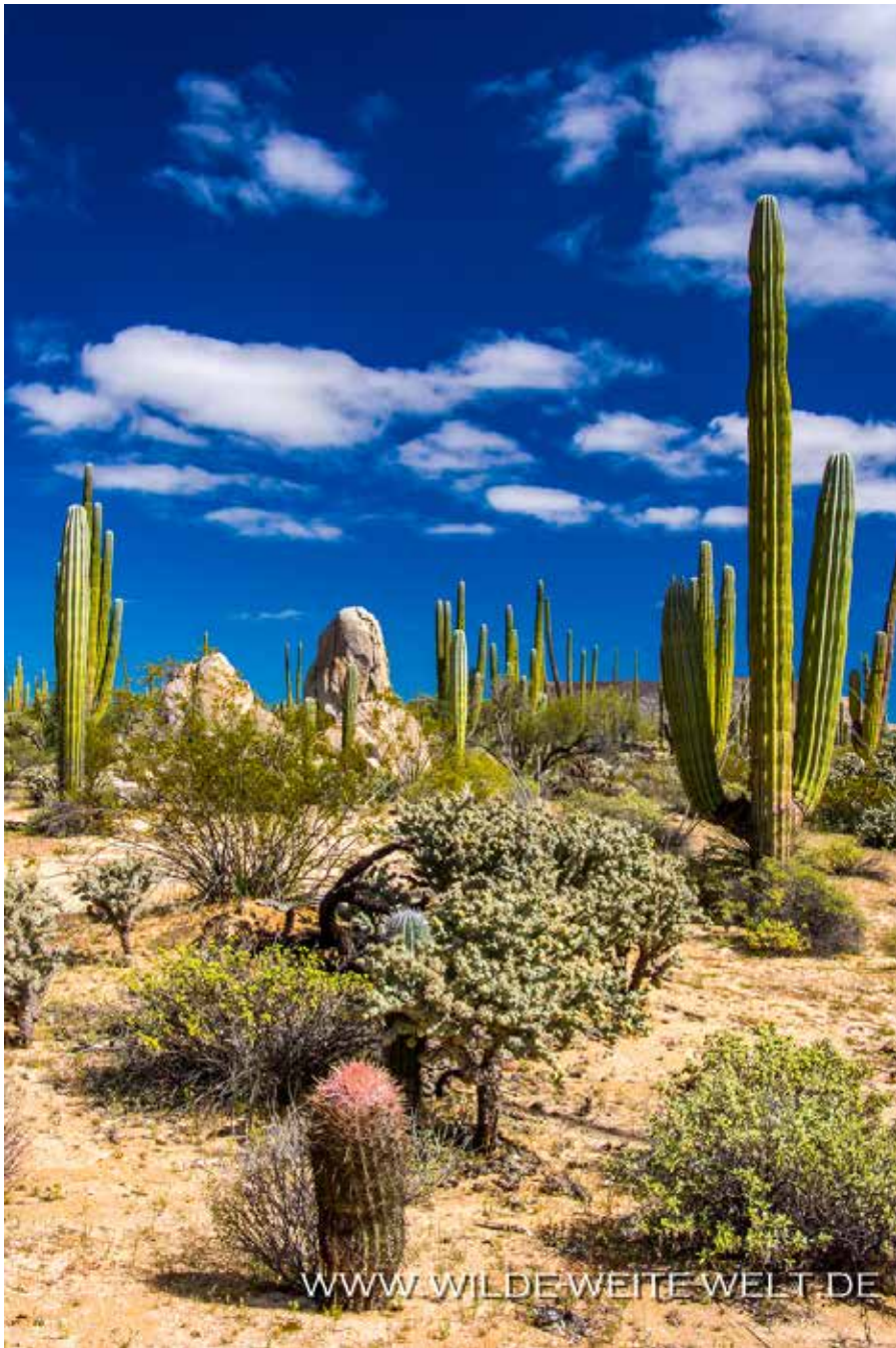
BARREL CACTUS, OLD MAN CACTUS, CARDON & CIRIO [CATAVINIA]