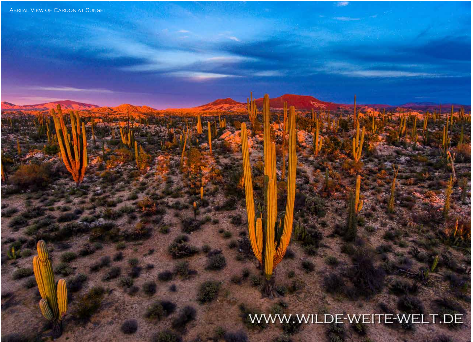
AERIAL VIEW OF CARDON AT SUNSET