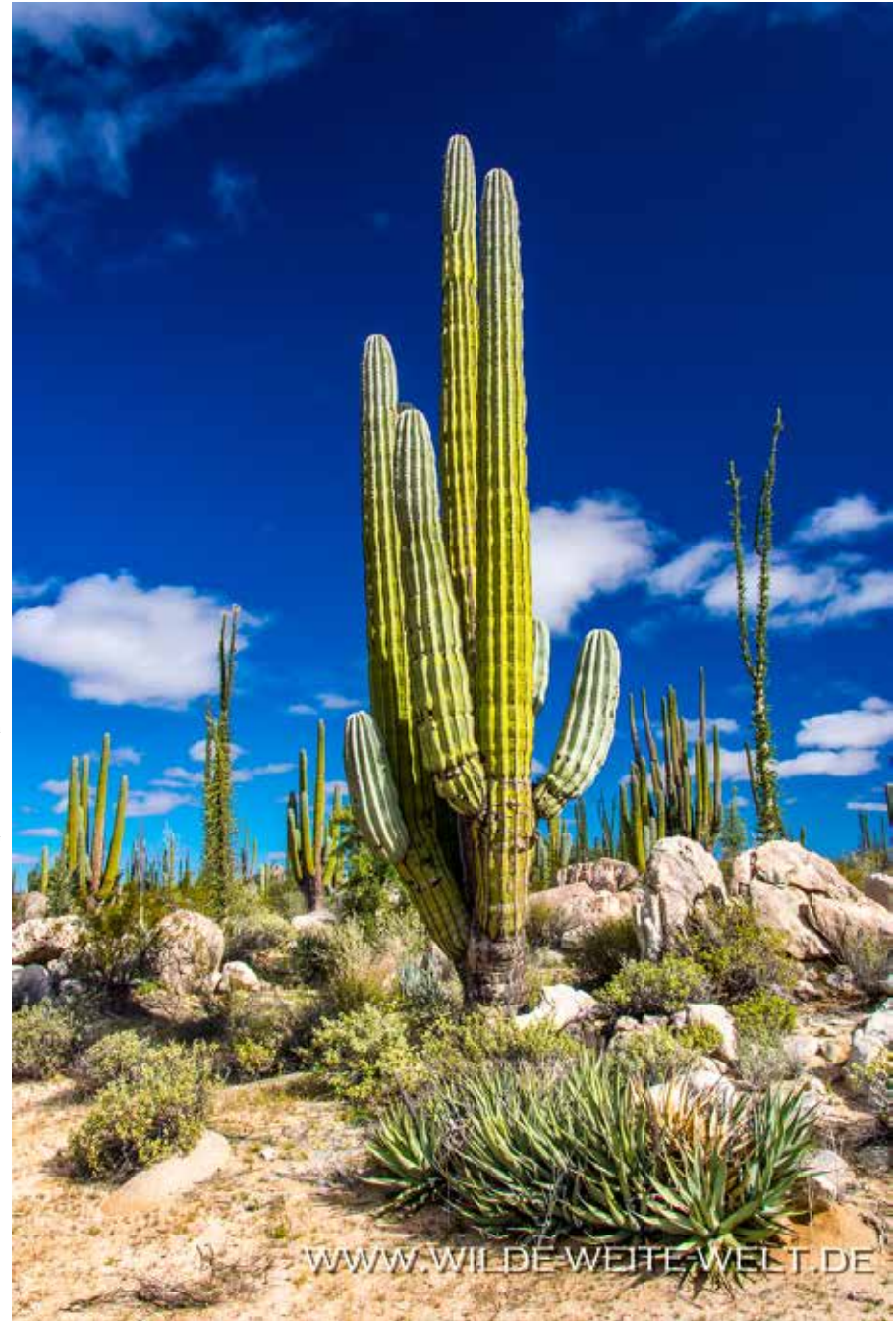
CARDON, CIRIO & CO. [CATAVINIA]