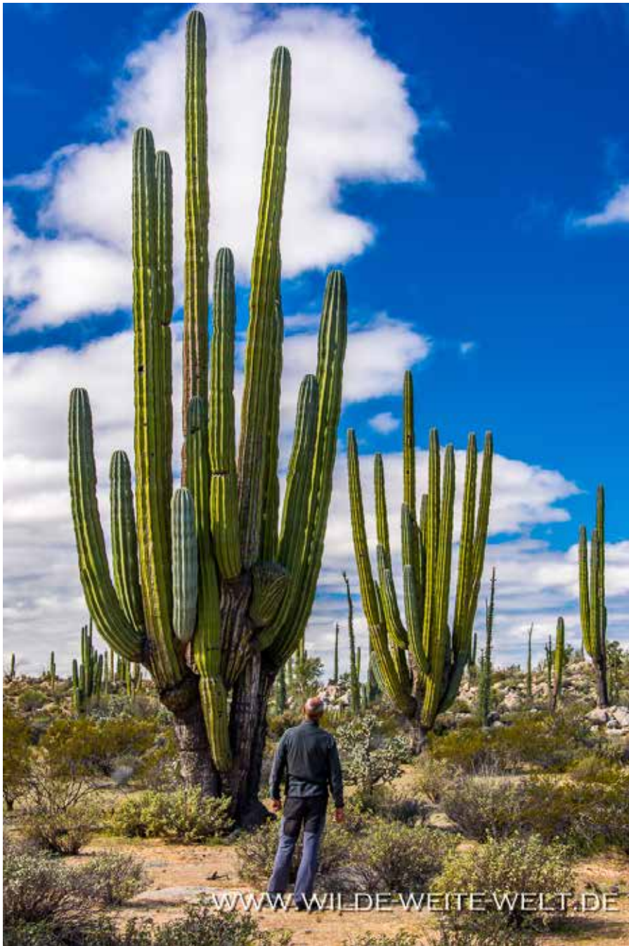
CARDON & CIRIO [CATAVINIA]