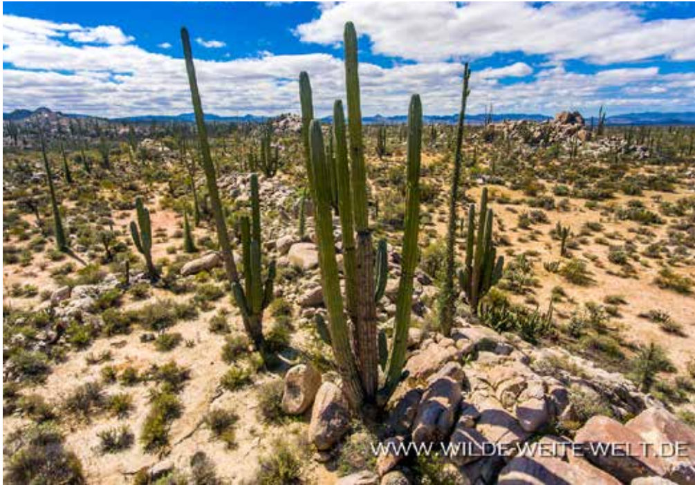
AERIAL VIEW CARDON & CIRIO [CATAVINIA]