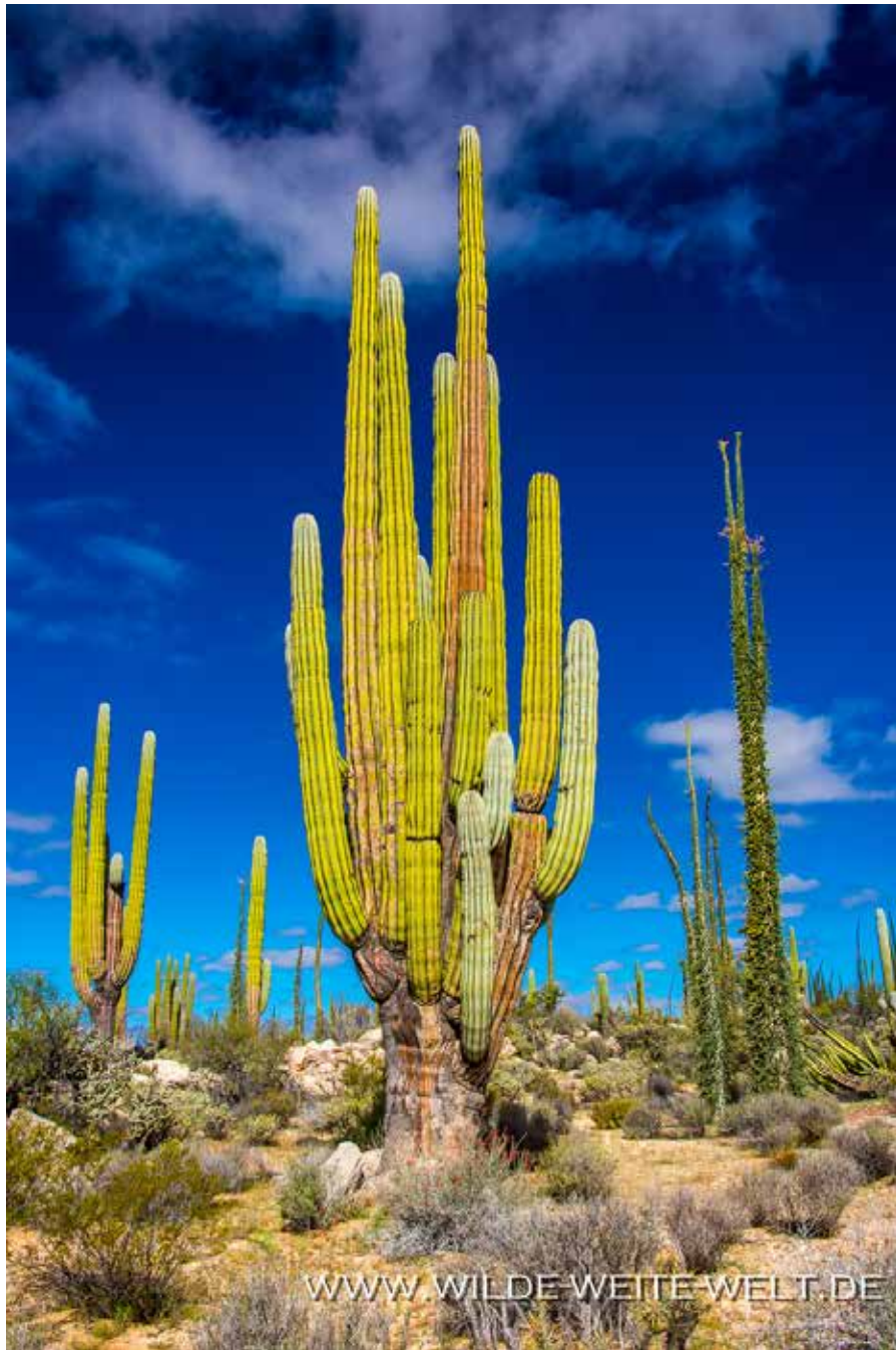
BARREL CACTUS, CARDON, CIRIO & CO. [CATAVINIA]