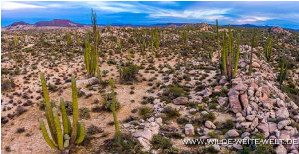
AERIAL VIEW OF CARDON