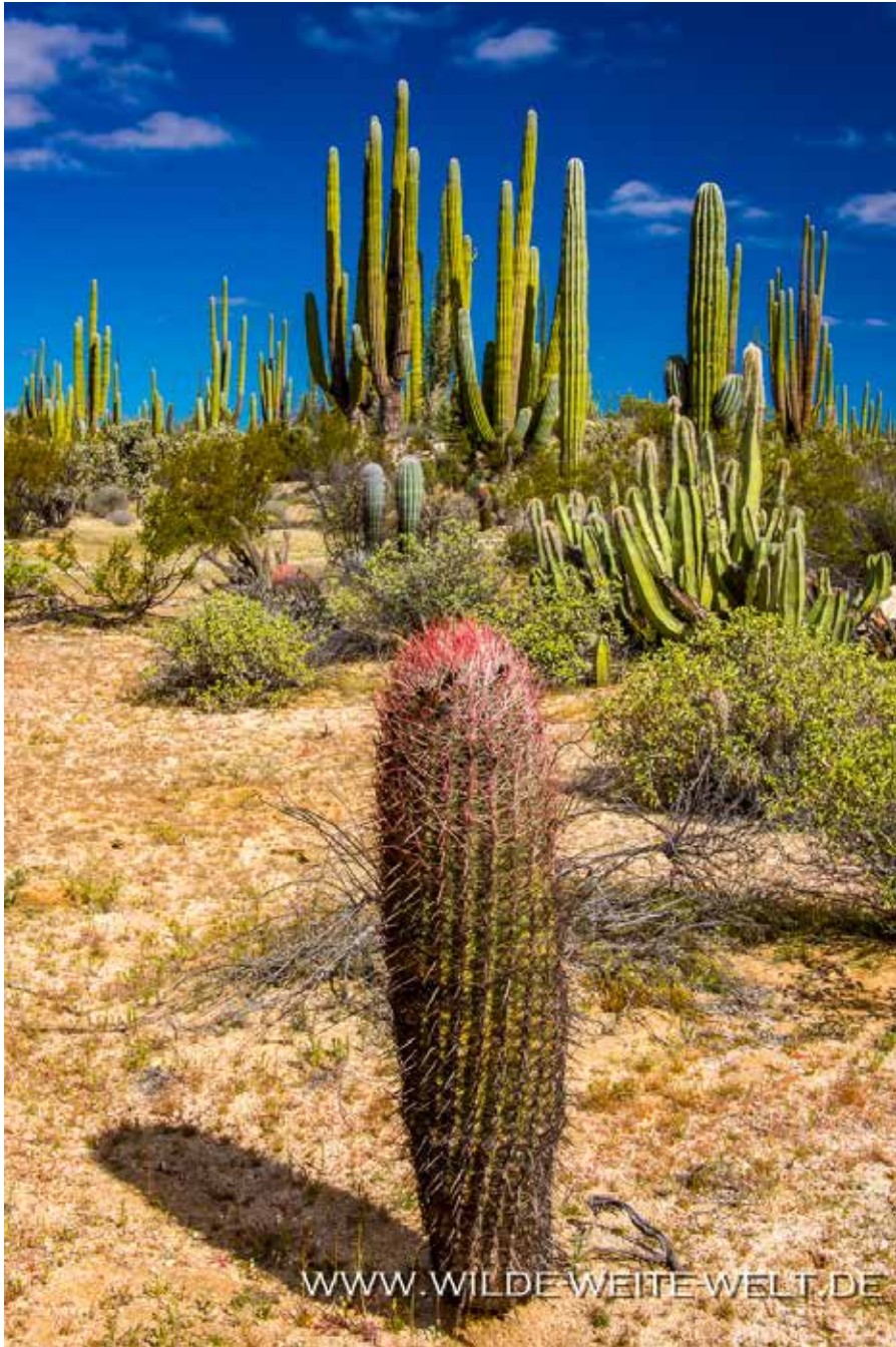
CARDON & CIRIO [CATAVINIA]