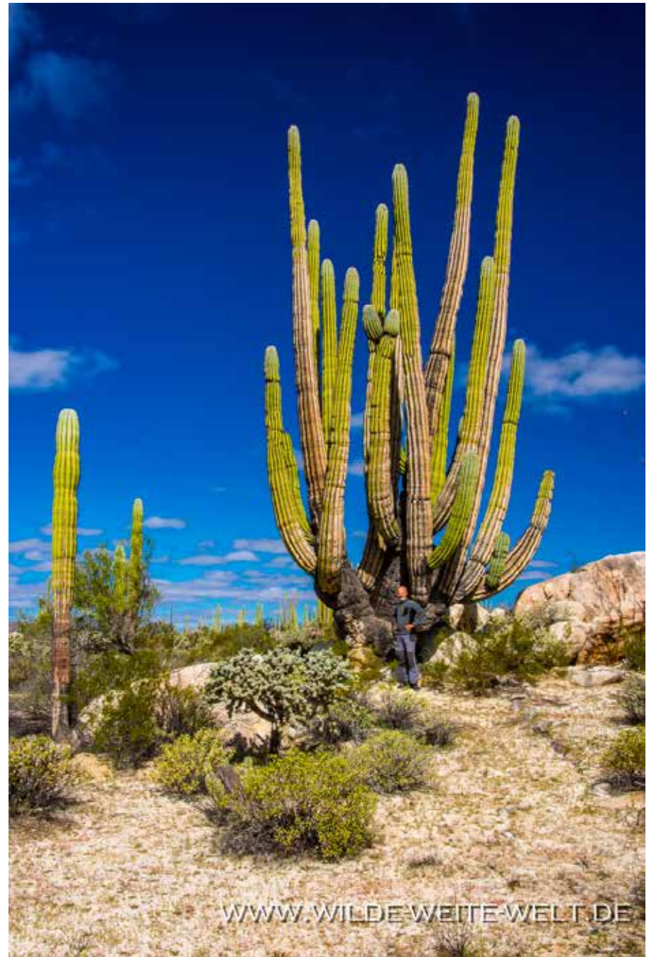
HP & CARDON [CATAVINIA]