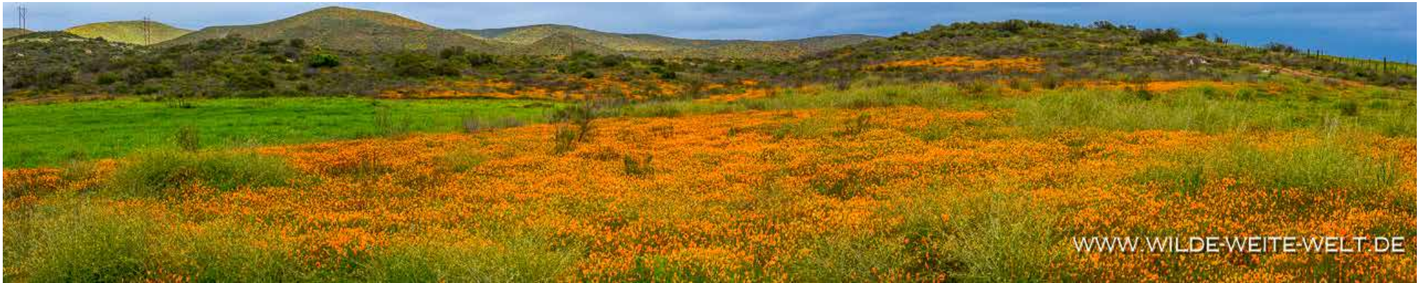
CALIFORNIA POPPIES, WEGEN REGENWETTER LEIDER MIT GESCHLOSSENEN BLÜTEN [MEX # 1, BAJA CALIFORNIA NORTE]