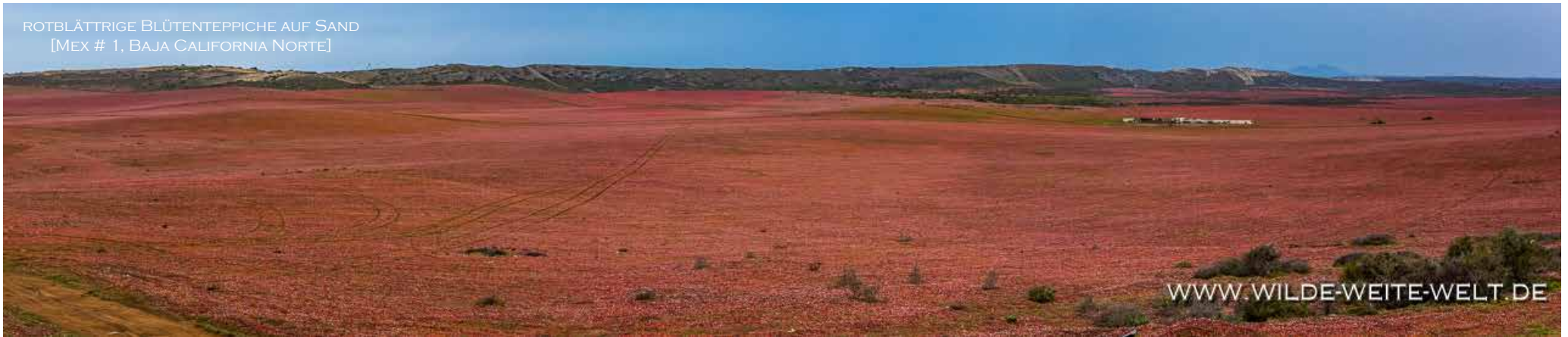
ROTBLÄTTRIGE BLÜTENTEPPICHE AUF SAND [MEX # 1, BAJA CALIFORNIA NORTE]