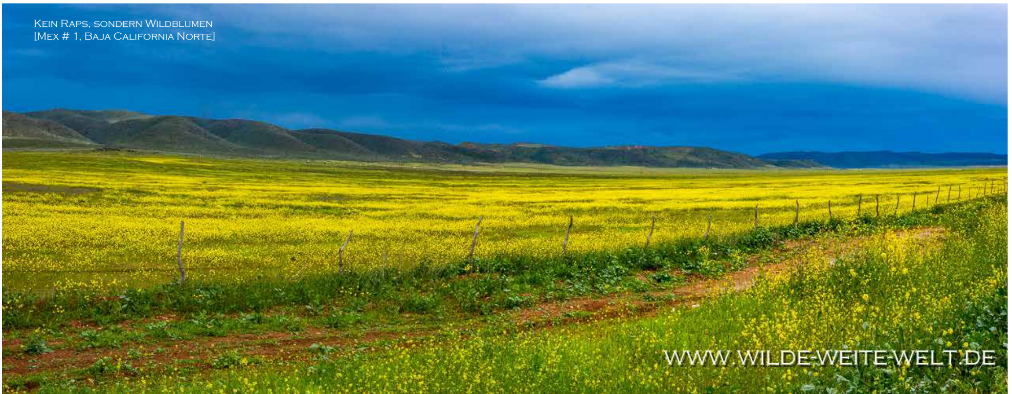
KEIN RAPS, SONDERN WILDBLUMEN [MEX # 1, BAJA CALIFORNIA NORTE]