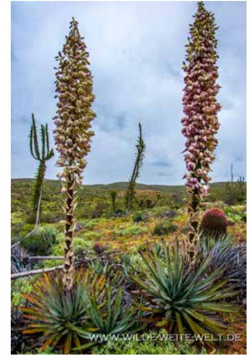
KAKTEEN & YUCCA UMGEHEN VON BLÜHENDEN WIESEN & ENCELIA FARINOSA