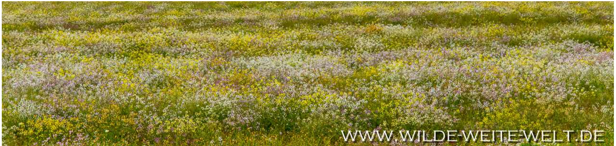
ÜPPIG BLÜHENDES BRACHLAND [MEX # 1, BAJA CALIFORNIA NORTE]