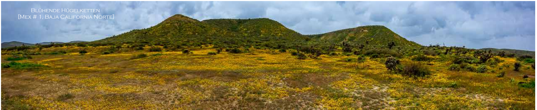
BLÜHENDE HÜGELKETTEN [MEX # 1, BAJA CALIFORNIA NORTE]