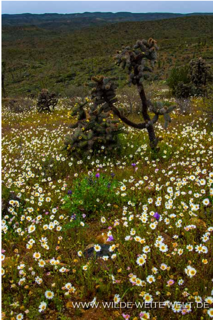
WILDFLOWERS ENTLANG DER MEX # 1 VON CATAVINIA NACH ESENENADA