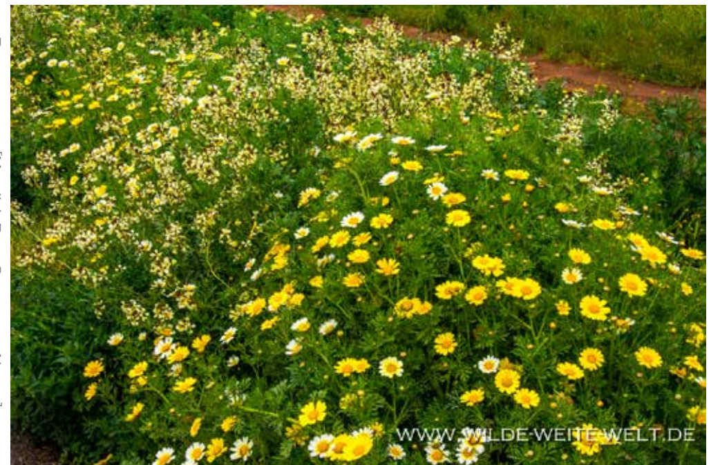
Üppige Blütenpracht entlang der Carretera, leider bei Regenwetter [MEX # 1, Baja California Norte]