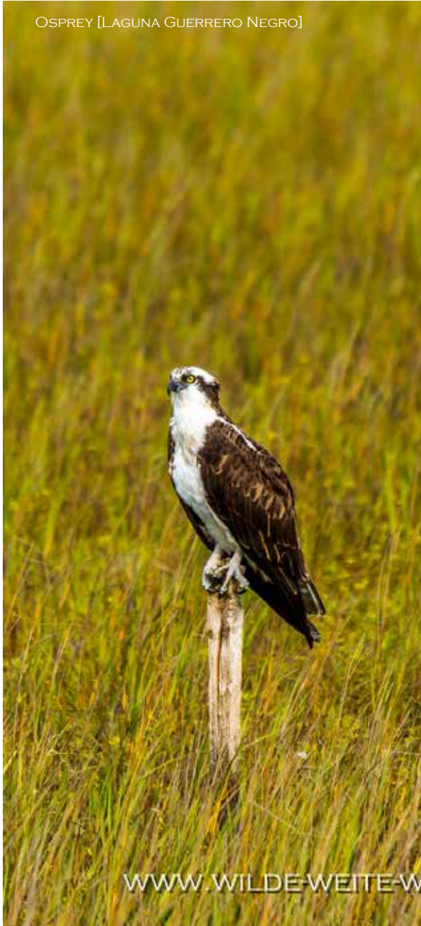
OSPREY [LAGUNA GUERRERO NEGRO]