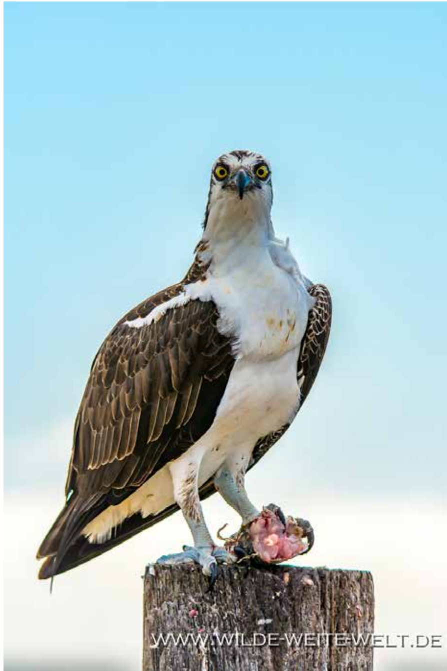
OSPREY / FISCHADLER [LAGUNA GUERRERO NEGRO]