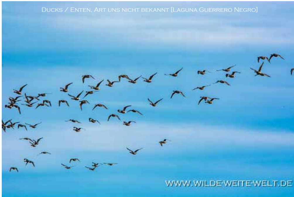
DUCKS / ENTEN, ART UNS NICHT BEKANNT [LAGUNA GUERRERO NEGRO]