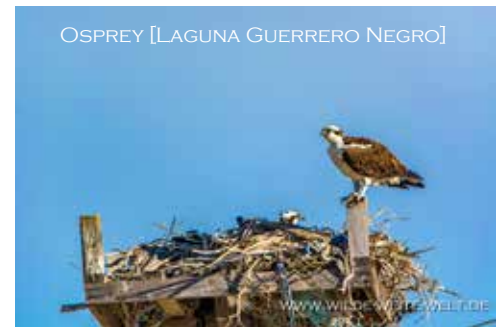
OSPREY [LAGUNA GUERRERO NEGRO]