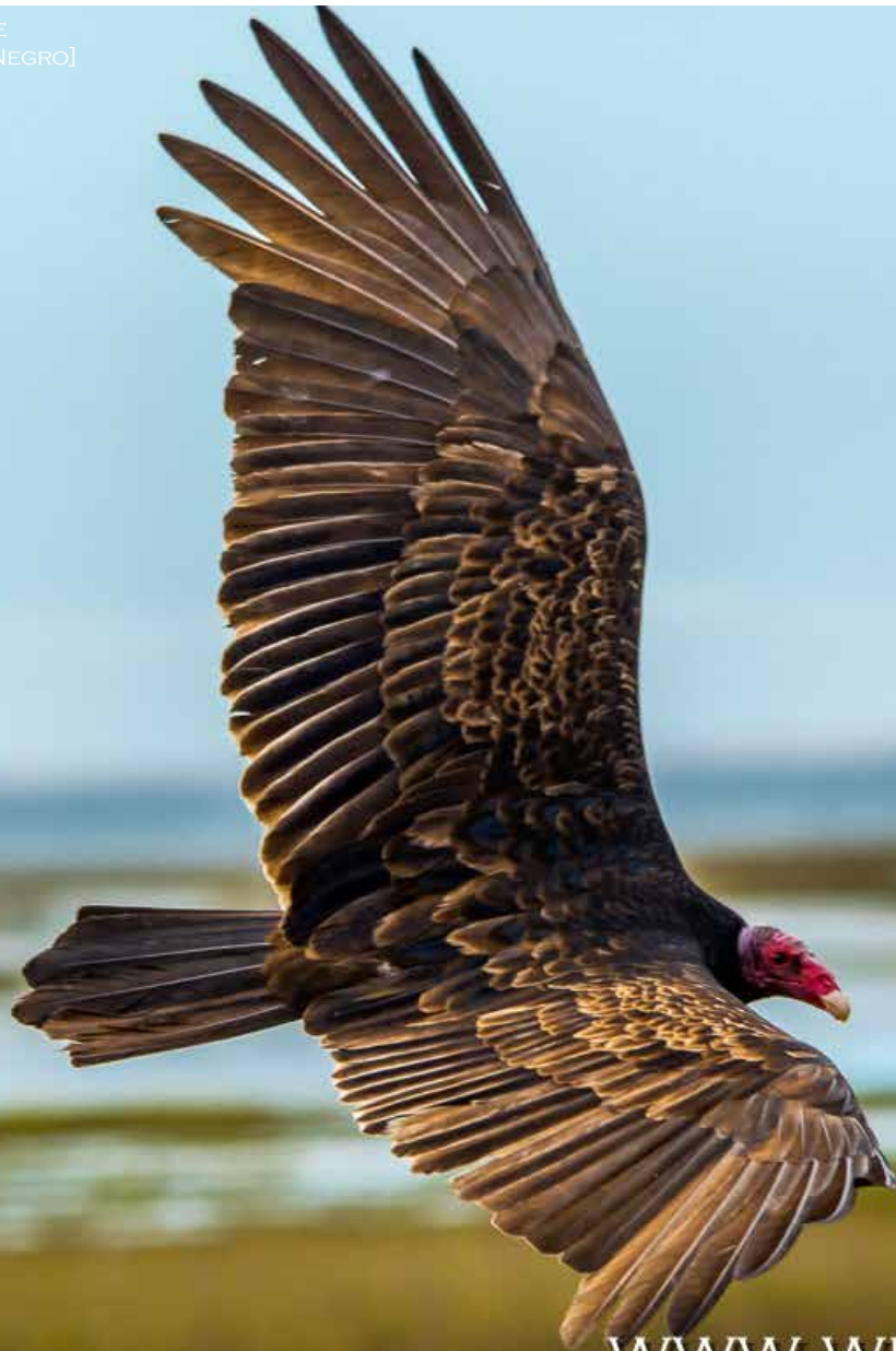
TURKEY VULTURE [LAGUNA GUERRERO NEGRO]