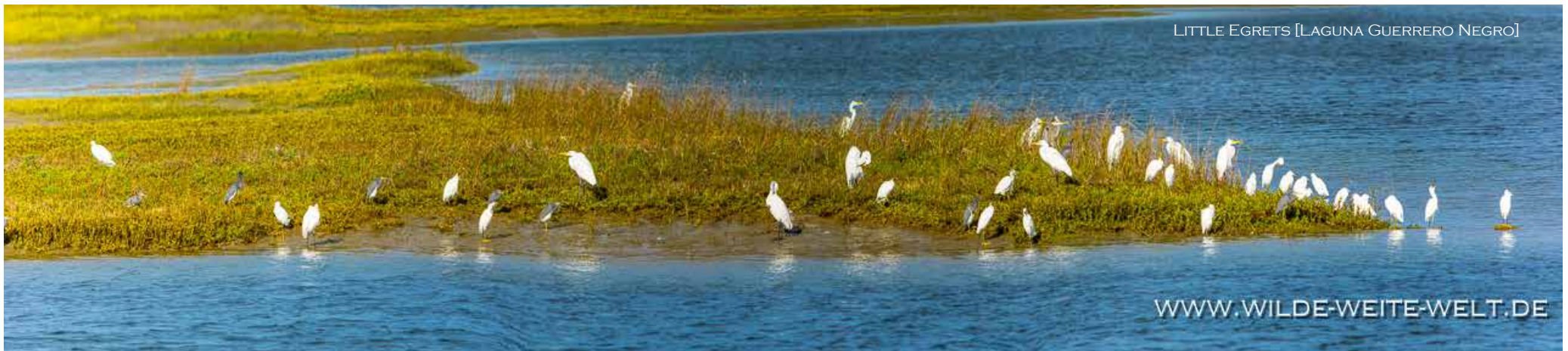
LITTLE EGRETS [LAGUNA GUERRERO NEGRO]