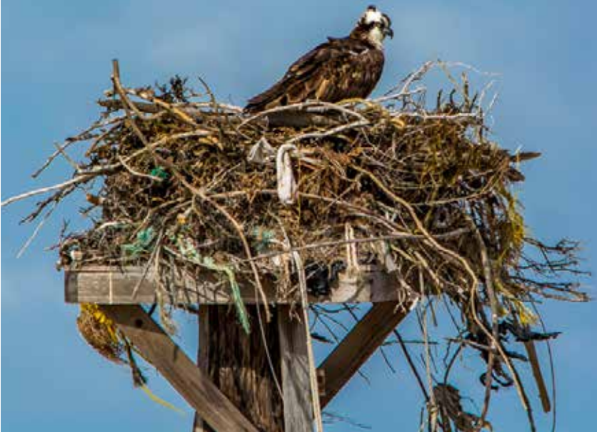
OSPREY [LAGUNA GUERRERO NEGRO]