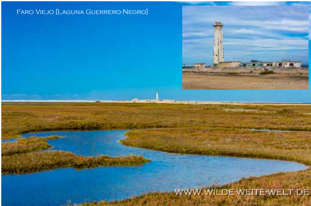
FARO VIEJO [LAGUNA GUERRERO NEGRO]