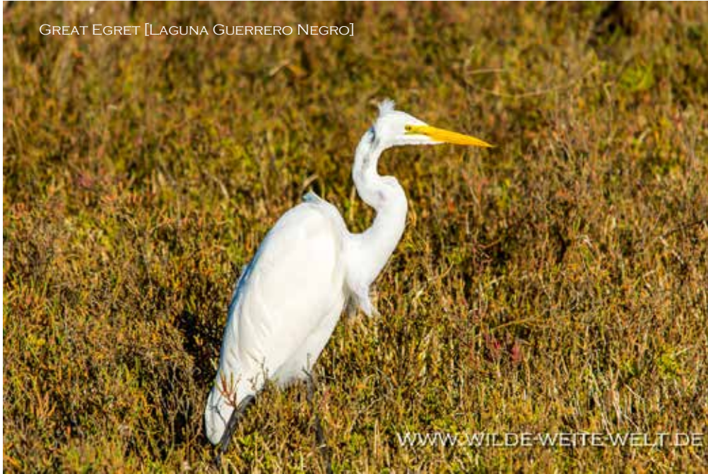
GREAT EGRET [LAGUNA GUERRERO NEGRO]