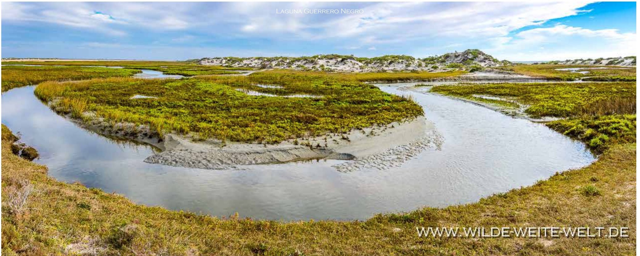
LAGUNA GUERRERO NEGRO