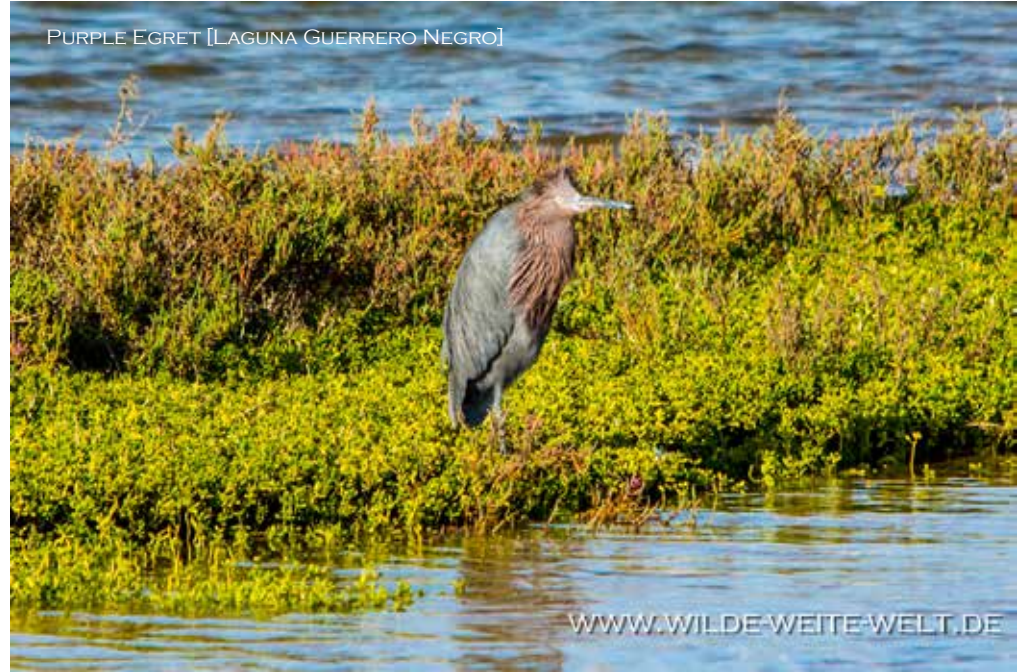
PURPLE EGRET [LAGUNA GUERRERO NEGRO]