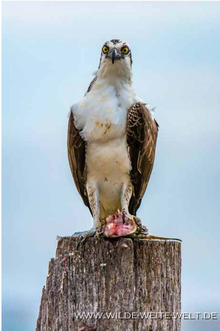
OSPREY / FISCHADLER [LAGUNA GUERRERO NEGRO]