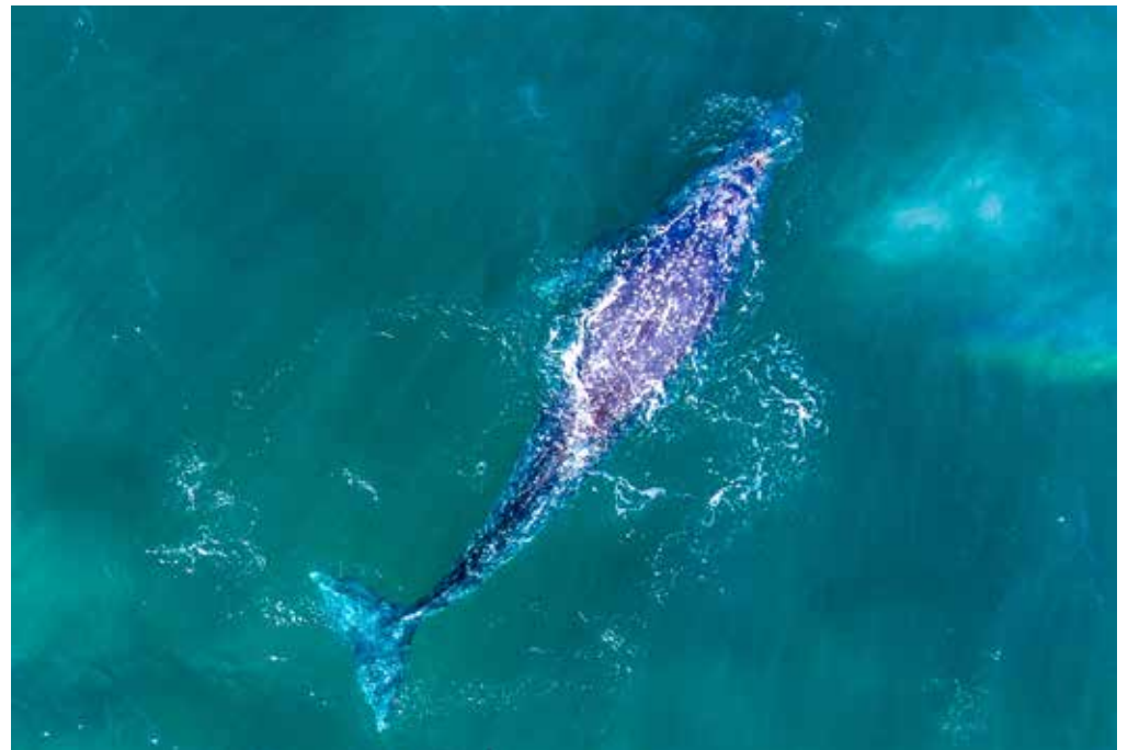
BUCKELWAL AM PLAYA PUNTA LOBOS AUS DER VOGELPERSPEKTIVE (DROHNE)