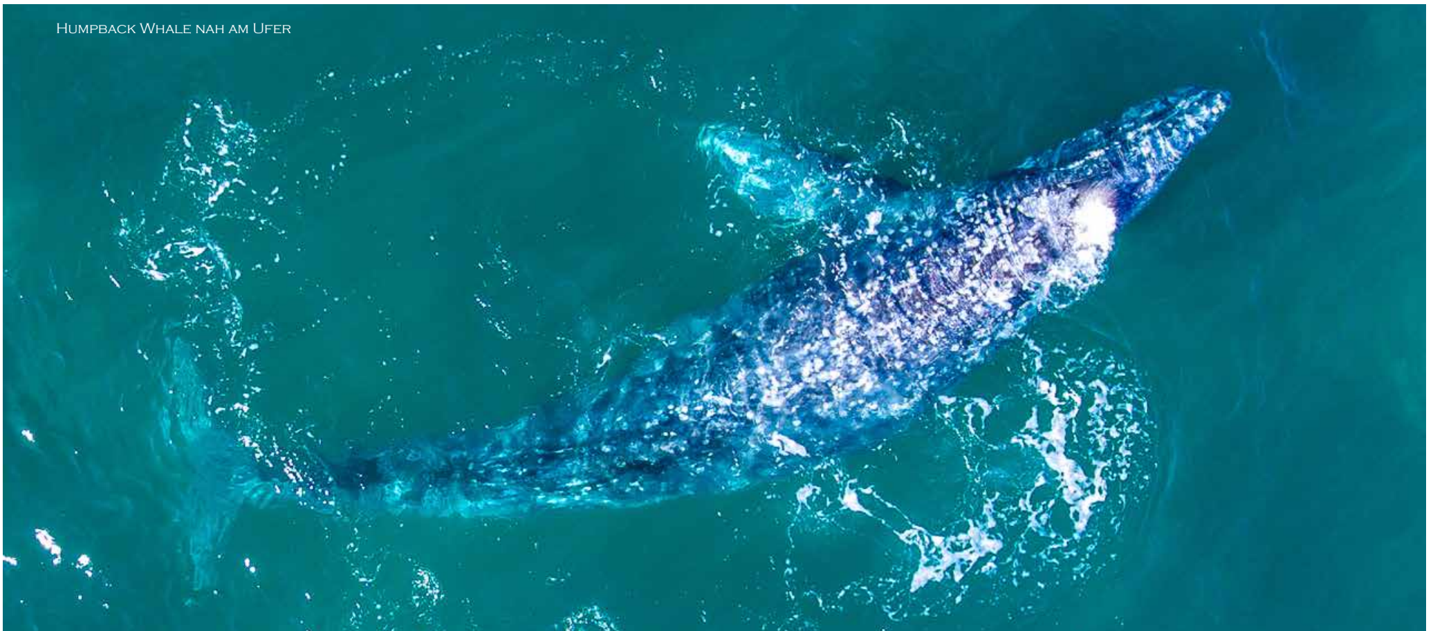
HUMPBACK WHALE NAH AM UFER