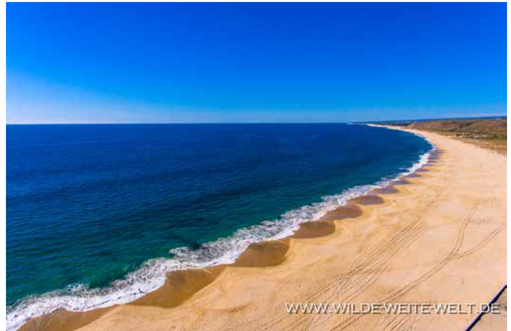
SANDSTRAND VON PUNTA LOBOS MIT EINEM HOTEL UND VIELEN DURCHZIEHENDEN WALEN