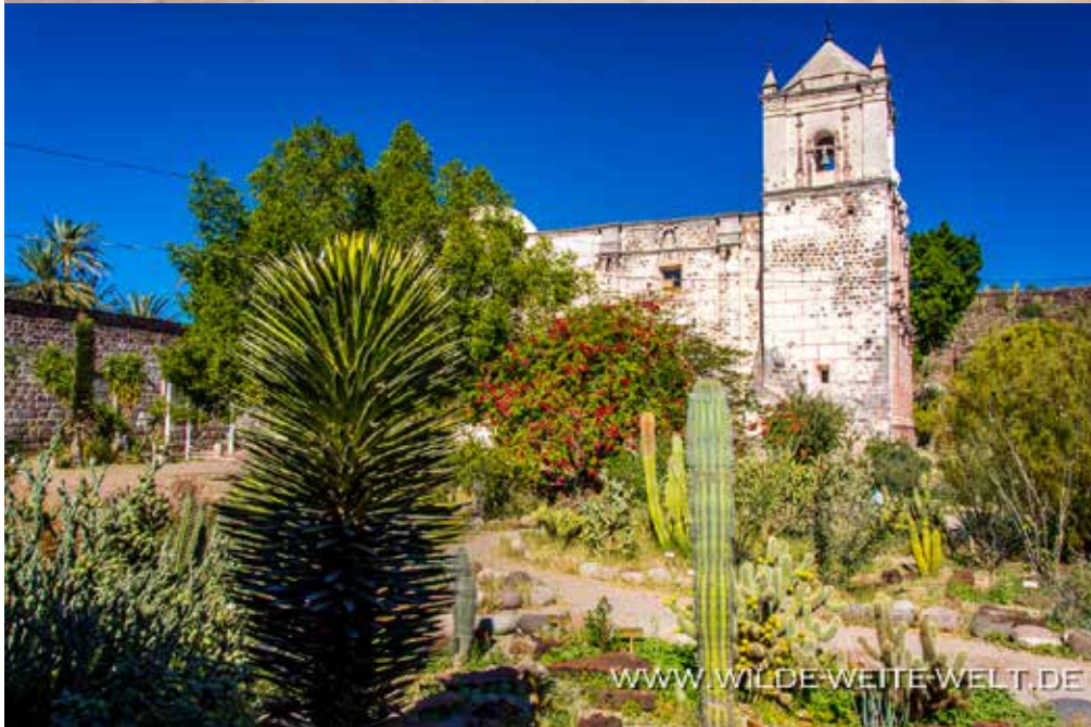
MISION SAN IGNACIO DE KADAKA- MAN & PLAZA MIT URALTEN FICUS BENJAMINI