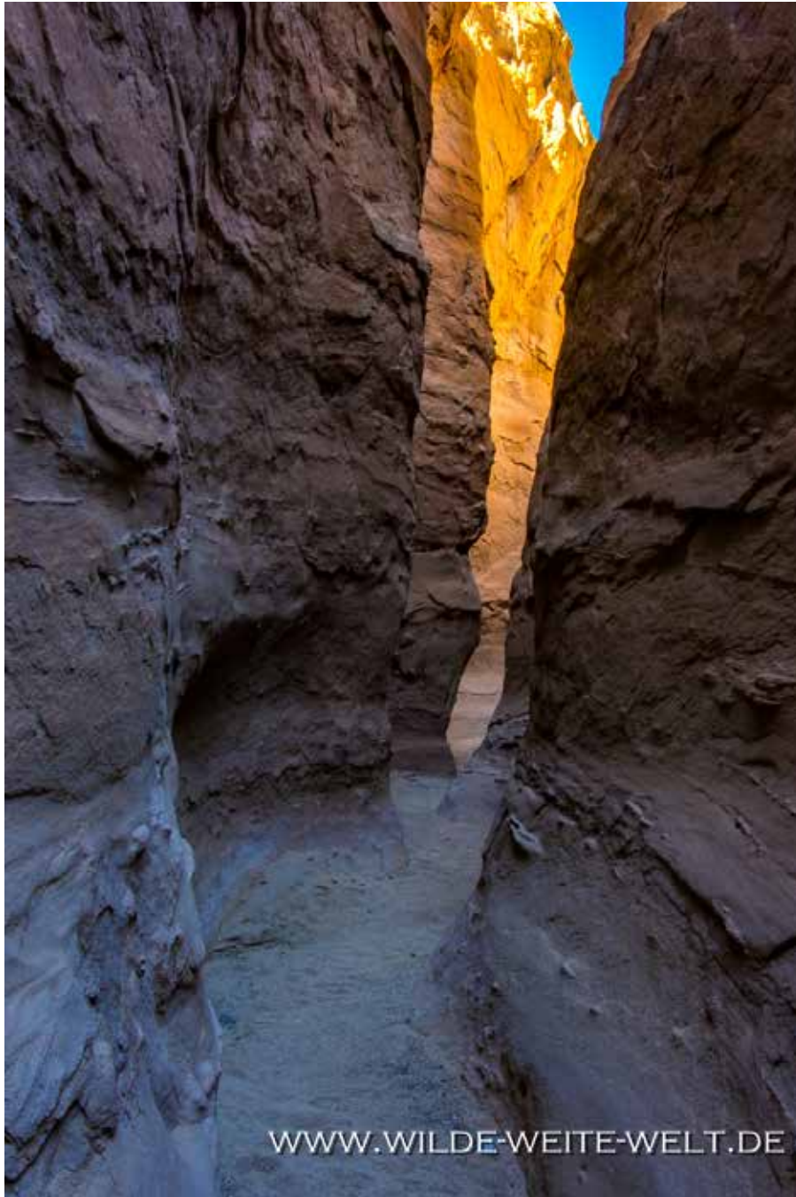
PALM WASH ARCH & SLOT CANYON [ANZA BORREGO STATE PARK]