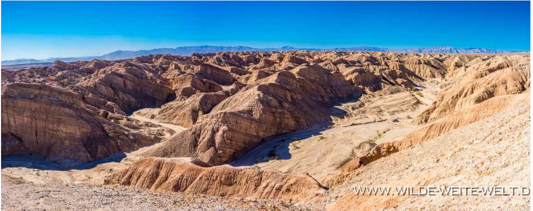
PALM WASH [ANZA BORREGO STATE PARK]