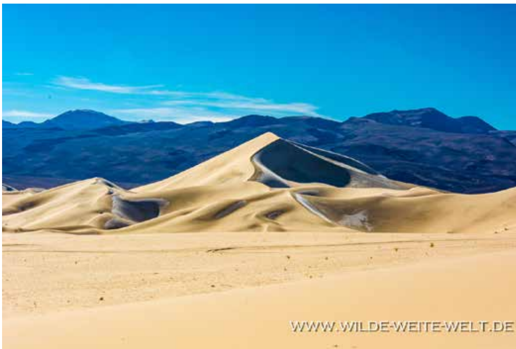
EUREKA DUNES (DEATH VALLEY NATIONAL PARK)