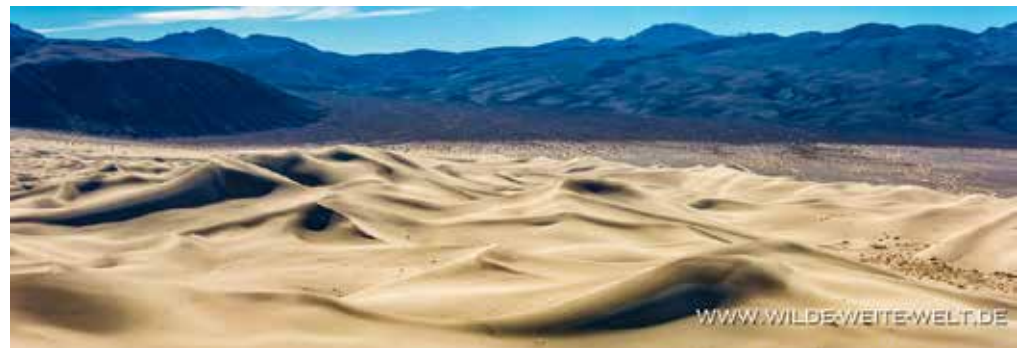
EUREKA DUNES [DEATH VALLEY NATIONAL PARK]