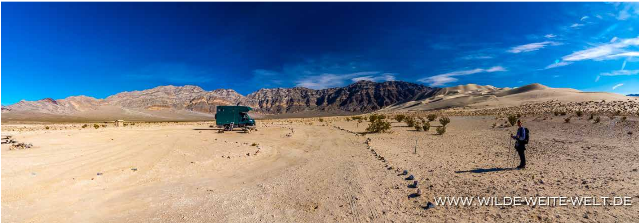
EUREKA DUNES [DEATH VALLEY NATIONAL PARK]