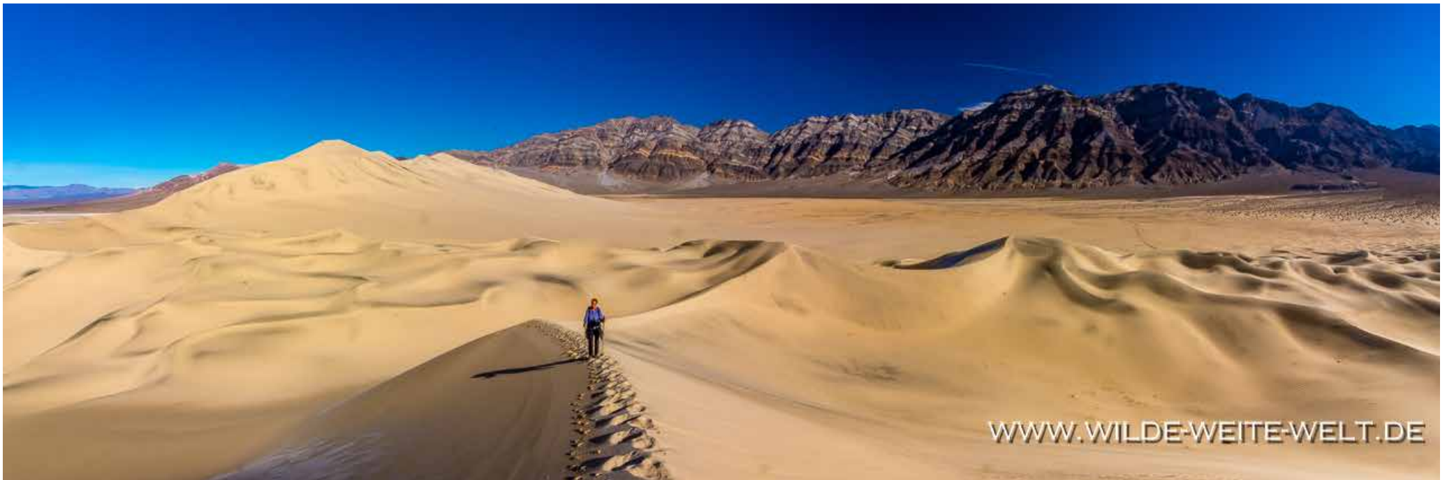
EUREKA DUNES [DEATH VALLEY NATIONAL PARK]