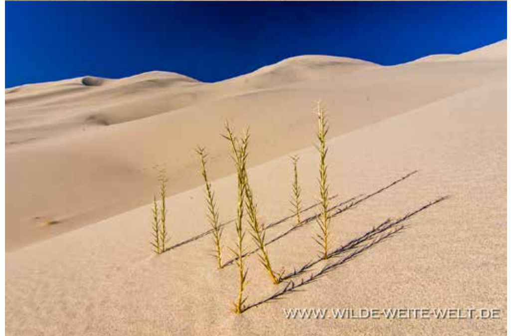
EUREKA DUNES [DEATH VALLEY NATIONAL PARK]