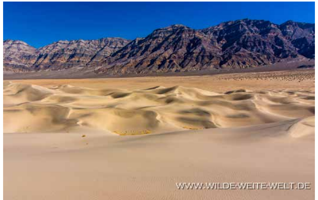
EUREKA DUNES [DEATH VALLEY NATIONAL PARK]