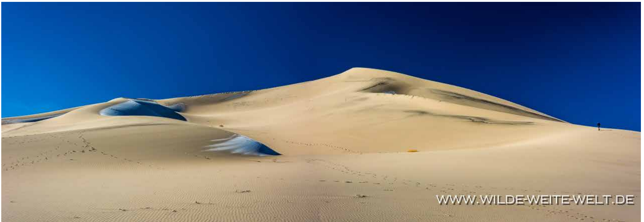
EUREKA DUNES [DEATH VALLEY NATIONAL PARK]