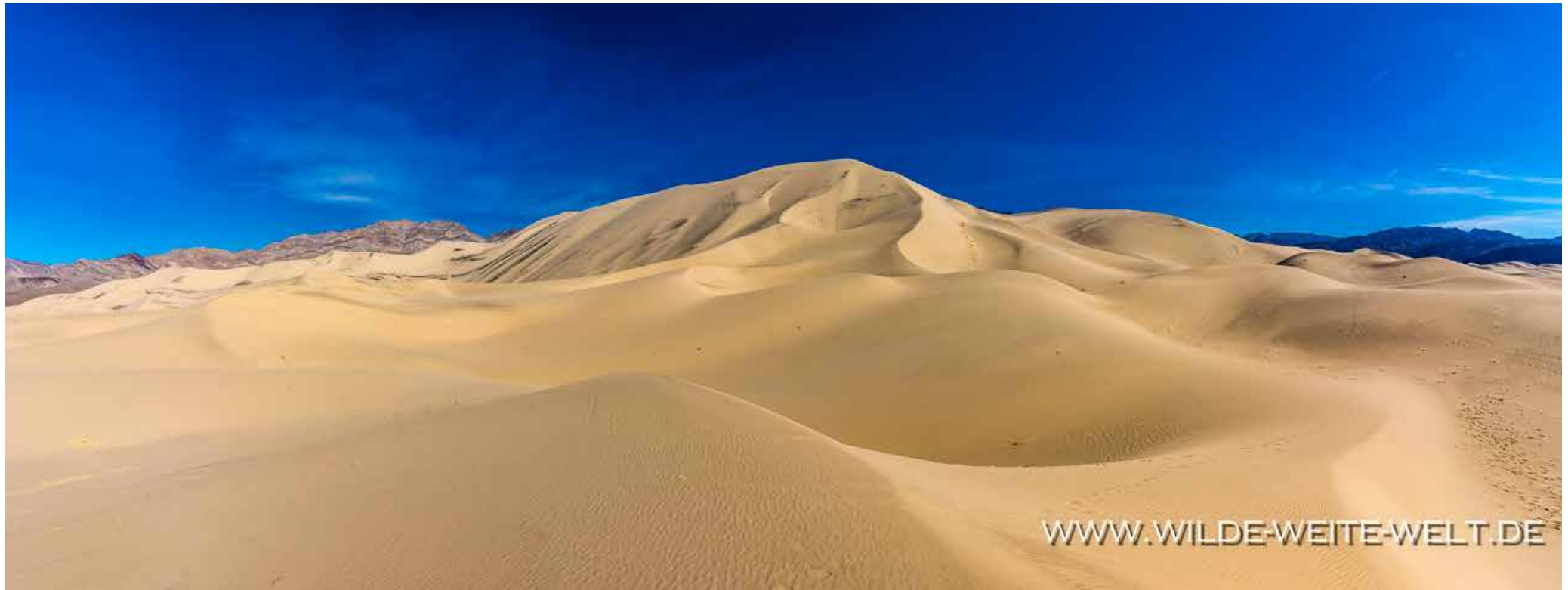
EUREKA DUNES [DEATH VALLEY NATIONAL PARK]