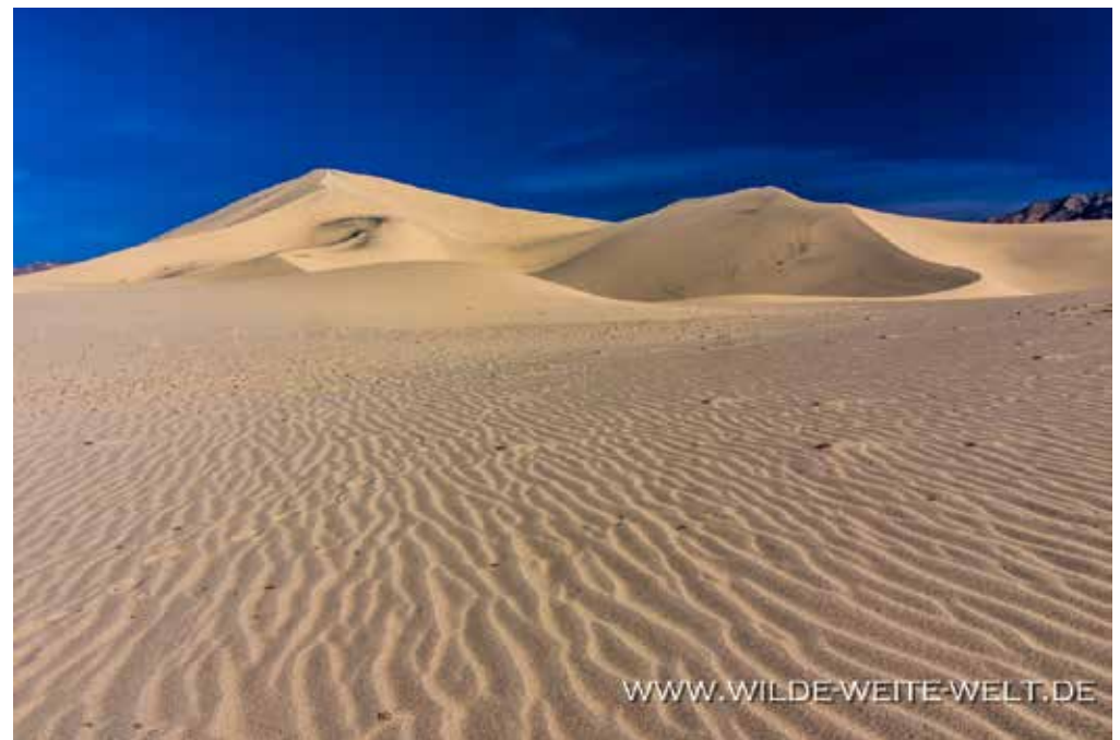
EUREKA DUNES [DEATH VALLEY NATIONAL PARK]