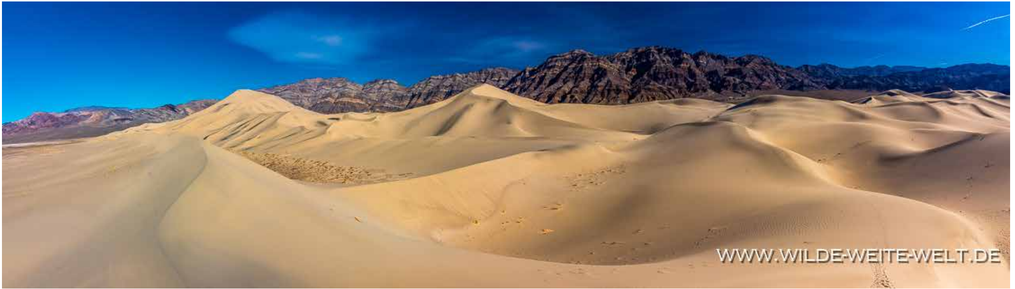
EUREKA DUNES [DEATH VALLEY NATIONAL PARK]