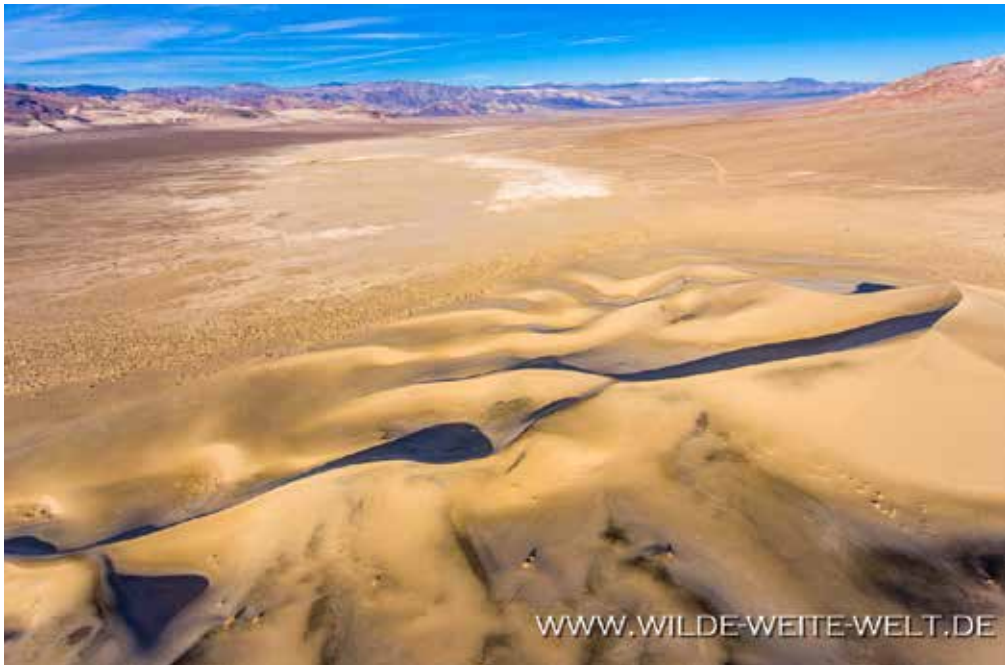
EUREKA DUNES (DEATH VALLEY NATIONAL PARK)