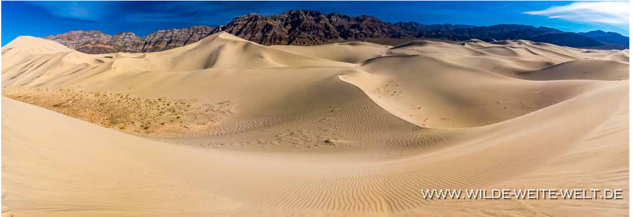
EUREKA DUNES [DEATH VALLEY NATIONAL PARK]