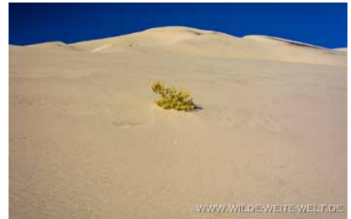
EUREKA DUNES [DEATH VALLEY NATIONAL PARK]