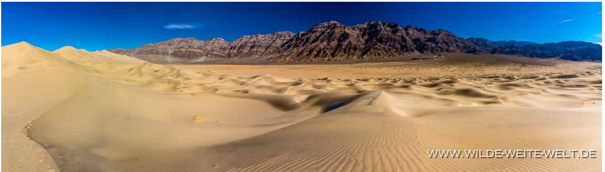
EUREKA DUNES [DEATH VALLEY NATIONAL PARK]