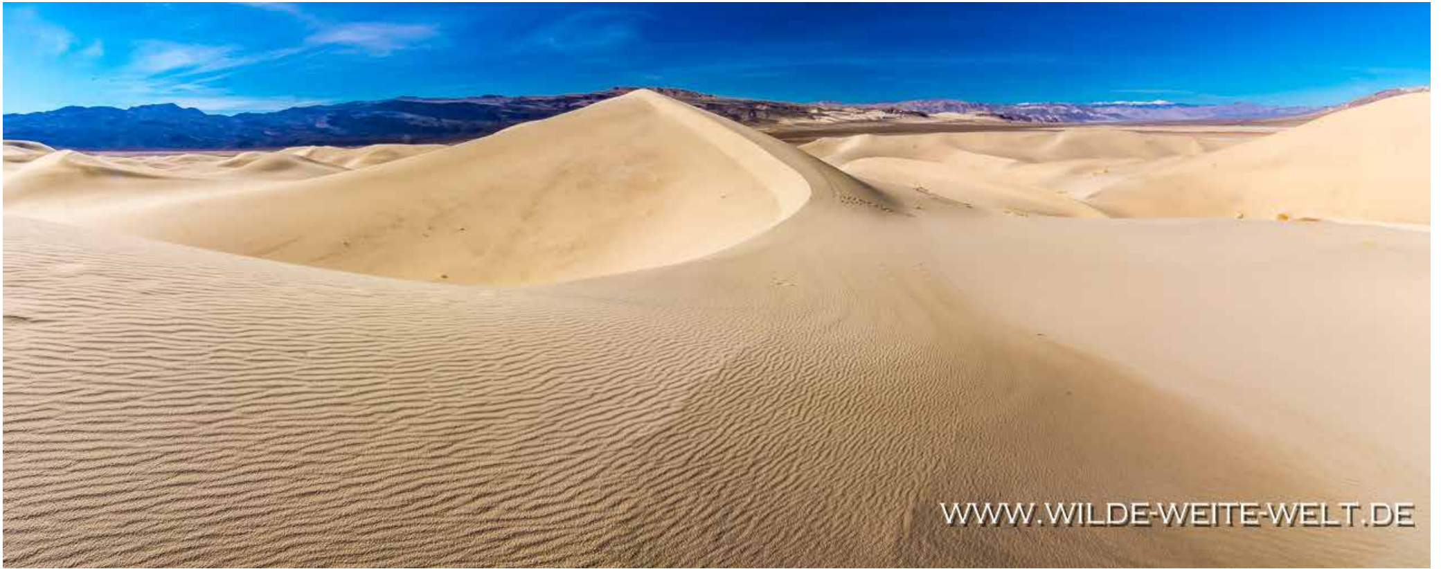
EUREKA DUNES [DEATH VALLEY NATIONAL PARK]