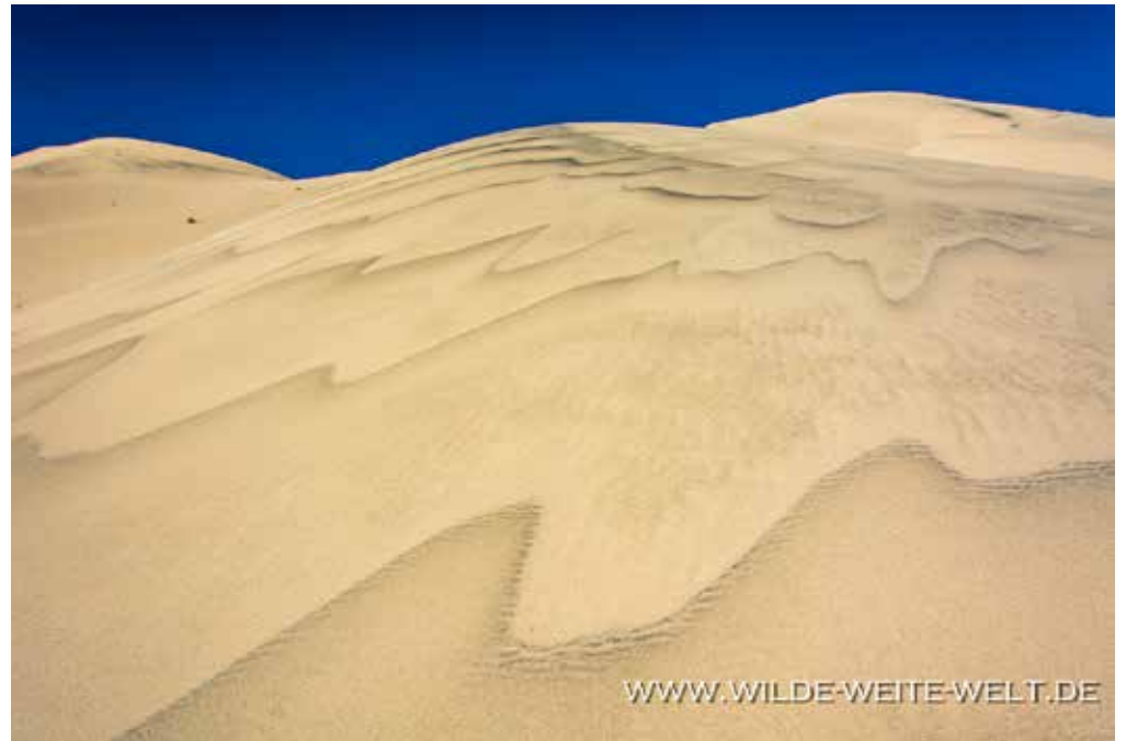
EUREKA DUNES [DEATH VALLEY NATIONAL PARK]