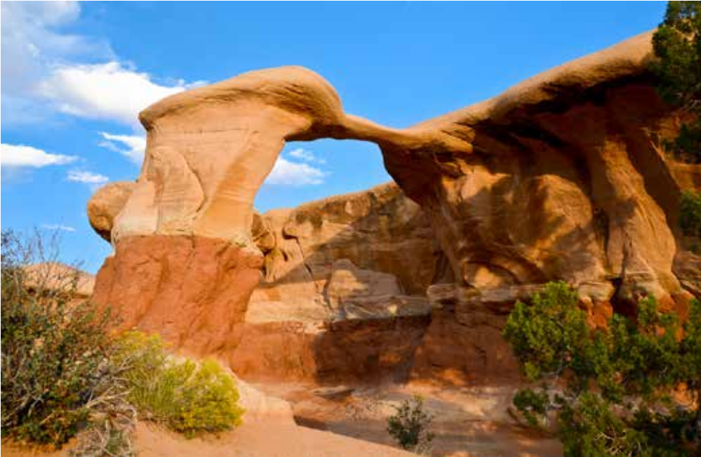
METATE ARCH IM DEVIL'S GARDEN [HOLE-IN-THE-ROCK ROAD, GSENM]