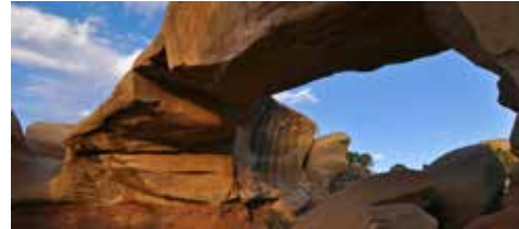
MANO ARCH IM DEVIL'S GARDEN [HOLE-IN-THE-ROCK ROAD, GSENM]