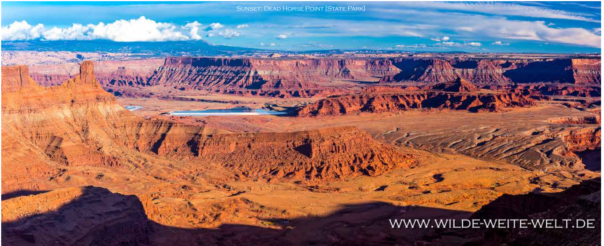
SUNSET: DEAD HORSE POINT [STATE PARK]