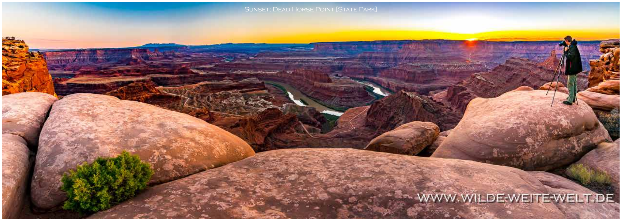
SUNSET: DEAD HORSE POINT [STATE PARK]