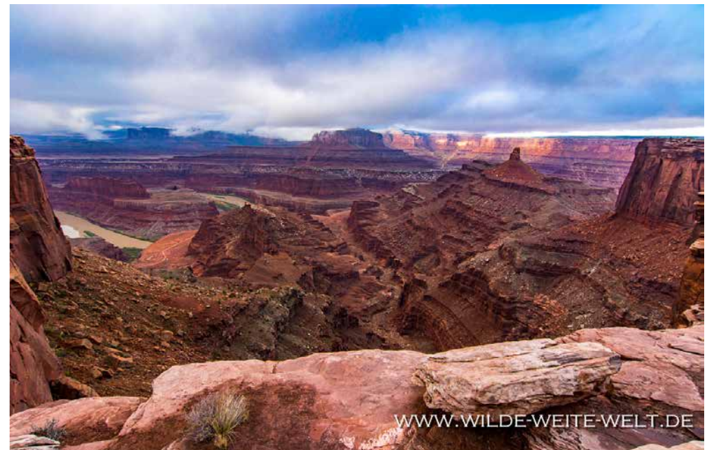
SUNRISE: DEAD HORSE POINT [STATE PARK]