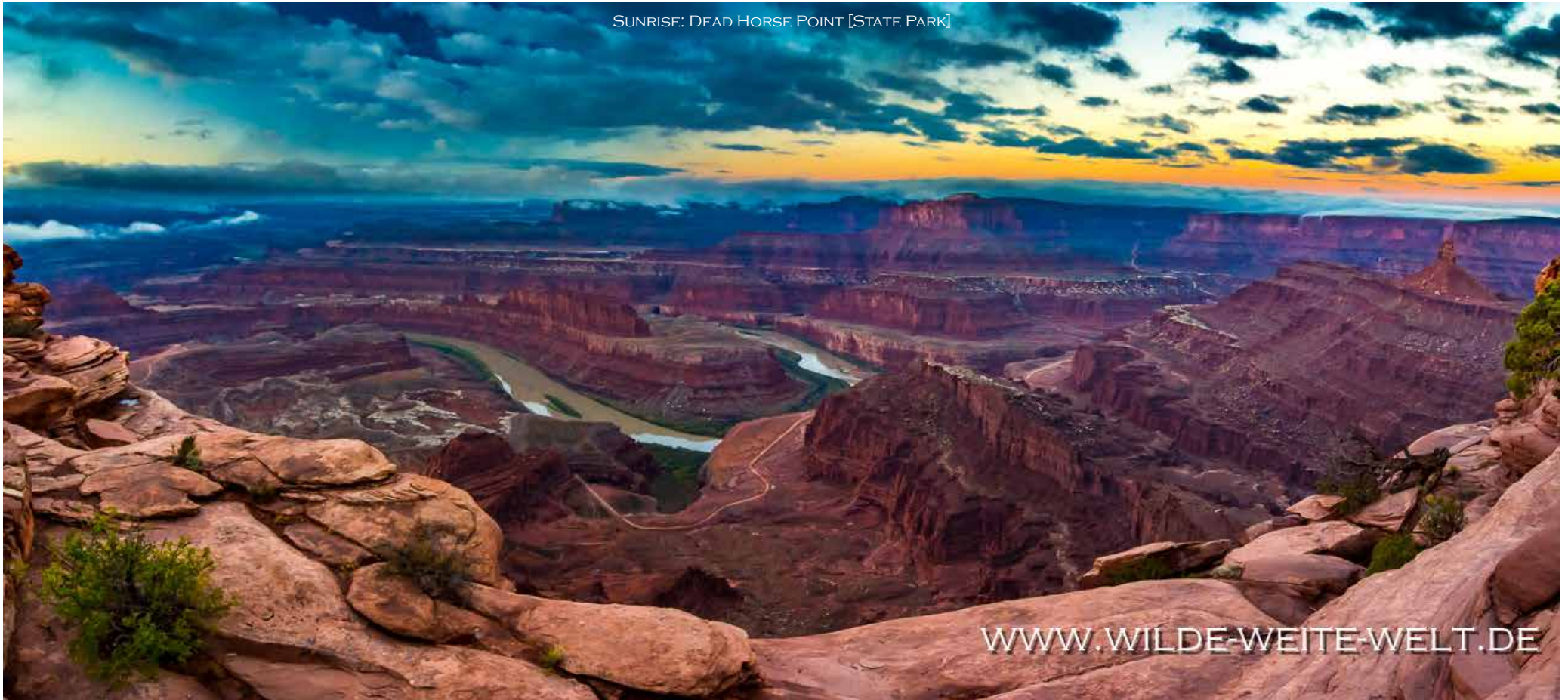
SUNRISE: DEAD HORSE POINT [STATE PARK]