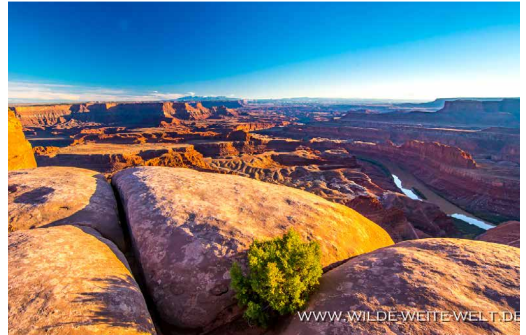
SUNSET: DEAD HORSE POINT [STATE PARK]