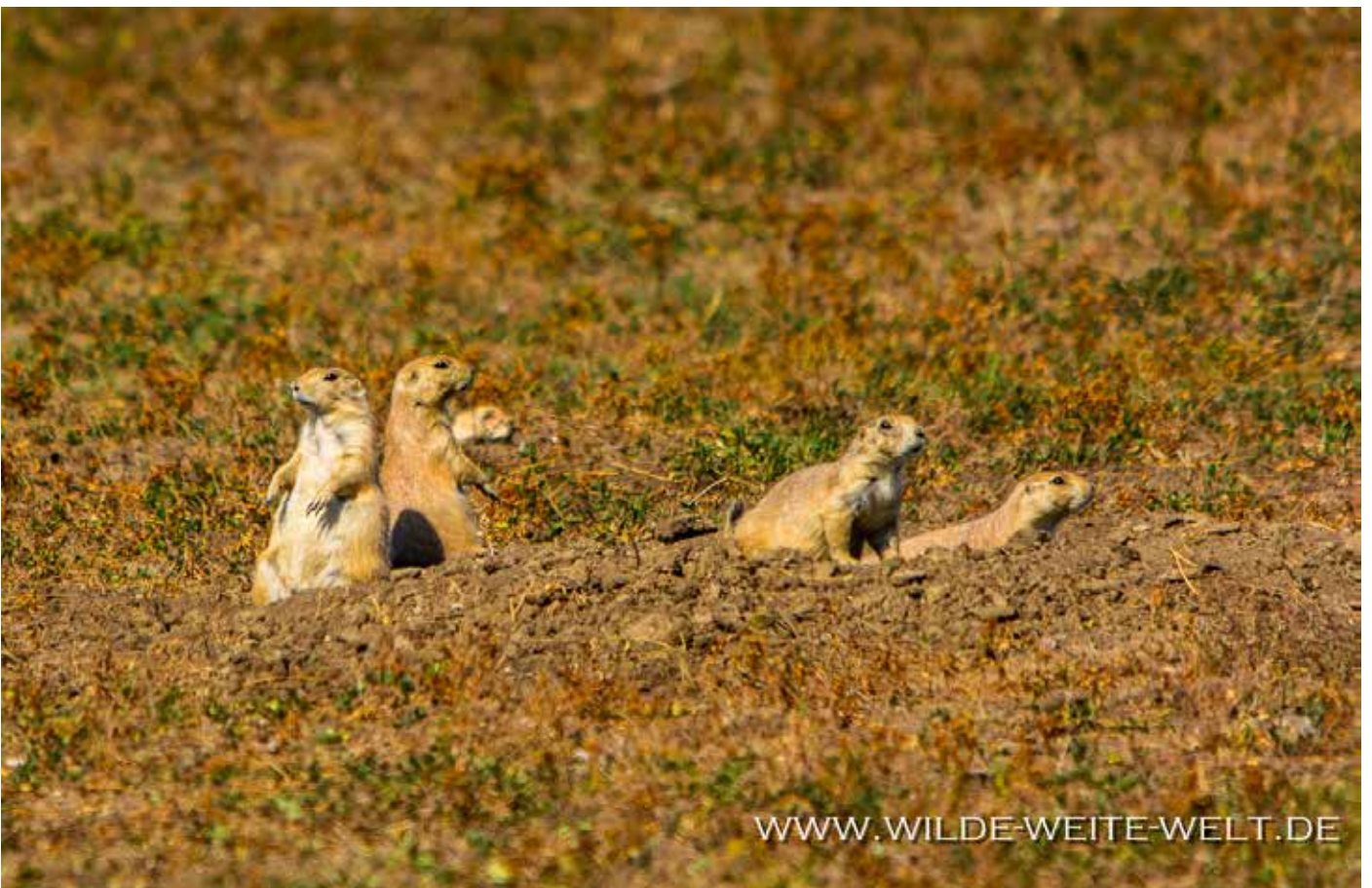
DIE NACHBARN DER BURROWING OWLS, DIE IHNEN ALTE BAUE ÜBERLASSEN HABEN [BADLANDS NATIONAL PARK]