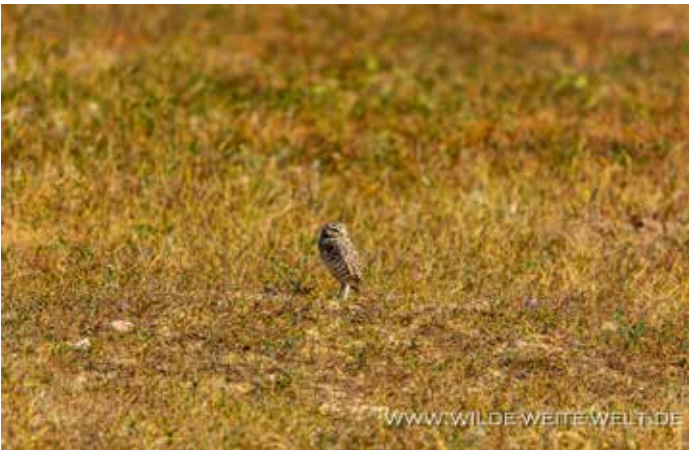
BURROWING OWL No. 1 [BADLANDS NATIONAL PARK]