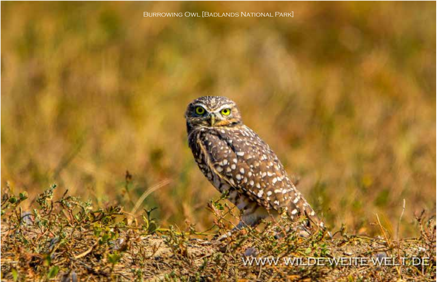
BURROWING OWL [BADLANDS NATIONAL PARK]