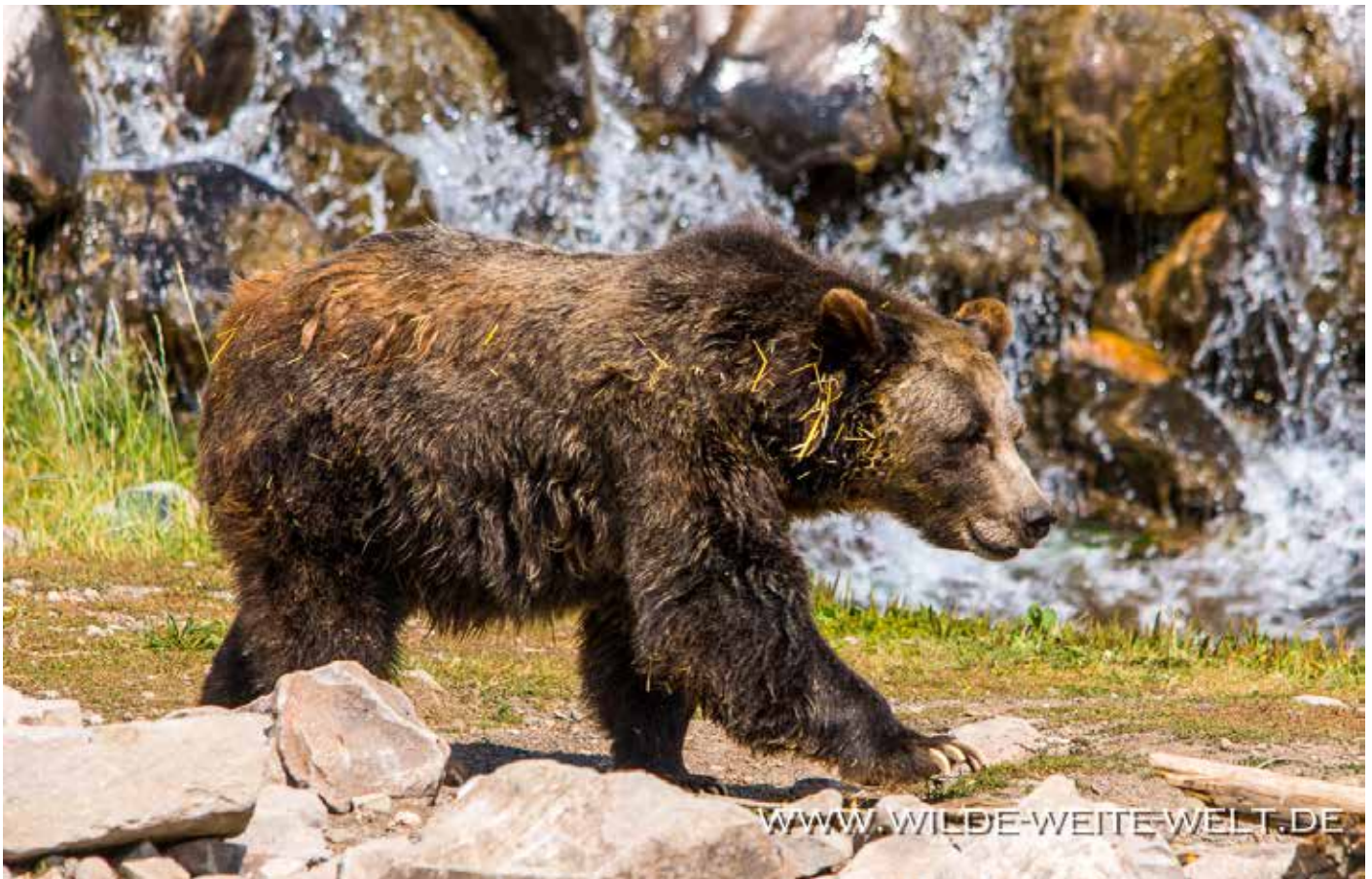
GRIZZLY-DAME SPIRIT, 22 JAHRE JUNG