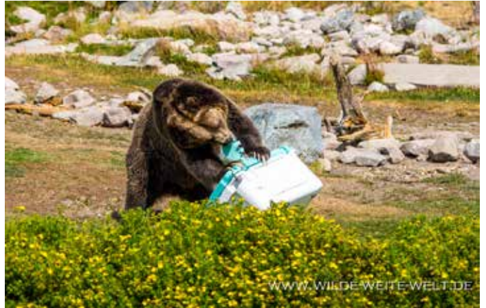
MIT GEDULD UND KONSTANZ SCHAFFT ES SPIRIT UNTER EINER STUNDE, DIE COOLER BOX ZU KNACKEN, IHRE AUSDAUER UND GEDULD IST EBENSO ERSTAUNLICH WIE DER GESCHICKTE EINSATZ ALL' IHRER KÖRPERFÄHIGKEITEN (ZÄHNE, GEWICHT, KRALLEN)