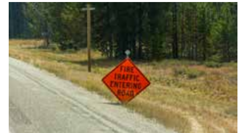
VON BOZEMAN ÜBER BIG SKY NACH WEST YELLOWSTONE: AUCH HIER BRENNEN DIE WÄLDER UND DIE SICHT IST DIESELIG...