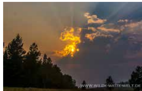
ÜBERNACHTUNG & SUNSET AT RED ROCKS PASS