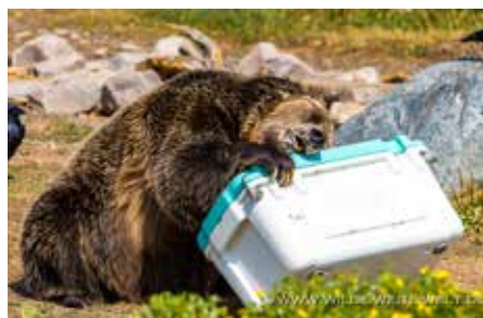
SPIRIT DREHT, WENDET, DRÜCKT, ZIEHT, SETZT IHRE KRALLEN, ZÄHNE UND IHR GANZES KÖRPERGEWICHT EIN