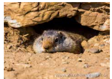
UINTA GROUND SQUIRRELS