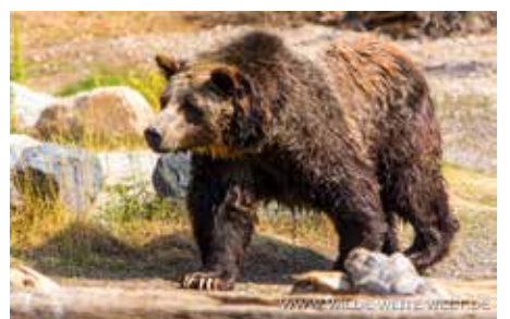
SPIRIT UND 101 STREIFEN DURCH DAS HABITAT UND DREHEN STEINE UM AUF DER SUCHE NACH DEM FUTTER, DAS DIE PFLEGER VERSTECKT HABEN