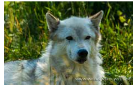
OBEN: WÖLFE - UNTEN: BALD EAGLE - GANZ UNTEN: GRIZZLY-DAME NAKINA