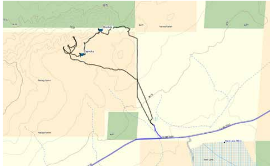
TRAIL FOSSIL FOREST

Von der Dirt Road aus sieht man den Canyon gut, in dem der Fossil Forest liegen soll. Es gibt jedoch ein Hindernis: Die Navajo Nation hat ein Areal abgezäunt. Also laufen wir zunächst in nur ungefähre Richtung am Zaun entlang und tauchen recht weit nördlich in den Canyon ein. Hoodoos gibt es keine, sondern vorwiegend Schicht-Hügel und einige Petrified Woods. Der Name „Petrified Forest“ ist definitiv irreführend, denn die Stammstücke sind nicht gebündelt, sondern weit verstreut wie überall in den Badlands südlich Farmington/Aztec. Fazit: Wer echtes Interesse an Badlands hat, wir auch an diesen Gefallen finden, für Einsteiger ist das Areal zu wenig ergiebig und „langweilig“.