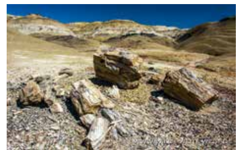
PETRIFIED WOOD: FOSSIL FOREST