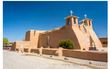
SAN FRANCISCO DEL ASIS CHURCH - RANCHOS DEL TAOS