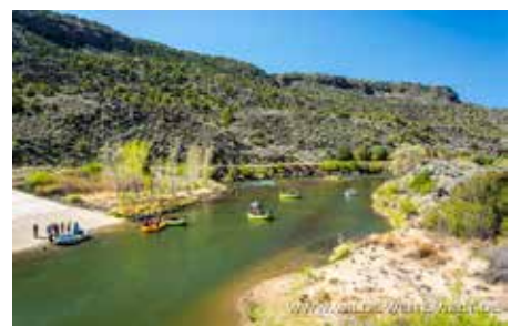
RIO GRANDE GORGE - PILAR