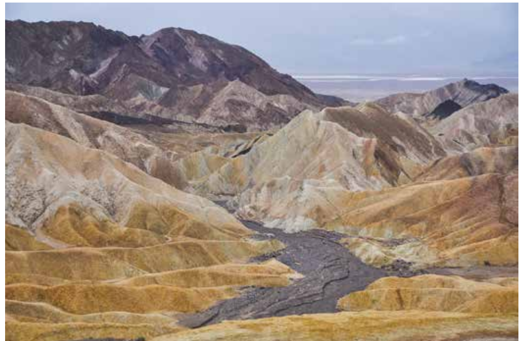
ZABRISKIE POINT [DEATH VALLEY]