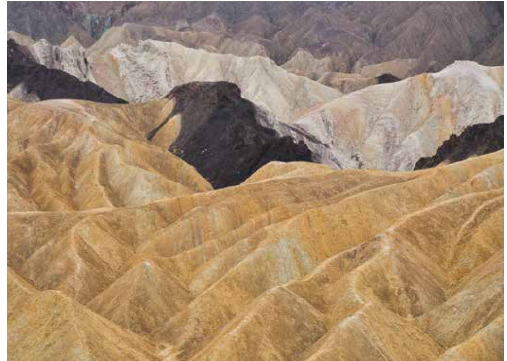
NO GO: WER INS DEATH VALLEY FÄHRT, DARF DIESEN AUSSICHTSPUNKT NICHT AUSLASSEN!

DER ZABRISKIE POINT LIEGT AN EINER DER HAUPTSTRASSEN DES DEATH VALLEY, IST GUT AUSGESCHILDERT UND LEICHT ERREICHBAR. DER NACHTEIL: MAN IST HIER SELTEN ALLEINE UND ZUM SUNRISE UND SUNSET KANN ES SCHON MAL RECHT ENG WERDEN