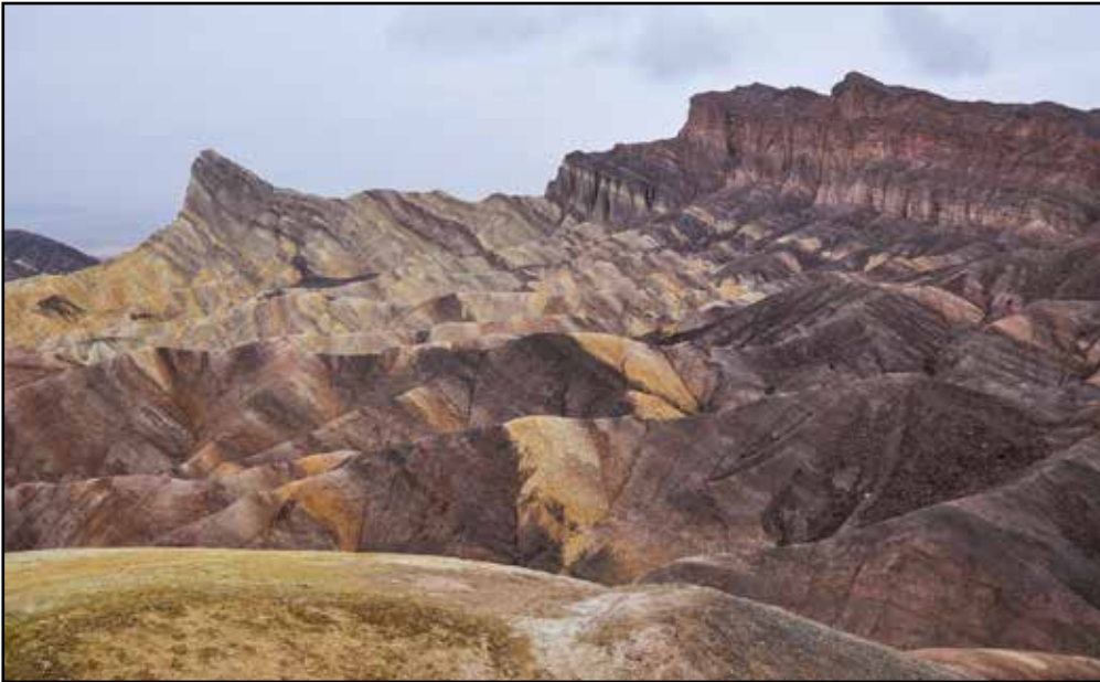
EINE LANDSCHAFT, SCHÖN WIE EIN GEMÄLDE. MEHR GLÜCK ALS WIR HAT, WER DEN ZABRISKIE POINT BEI STRAHLENDEM SONNENSCHNEIN UND NICHT UNTER EINER DICHTEN WOLKENDECKE ERLEBT